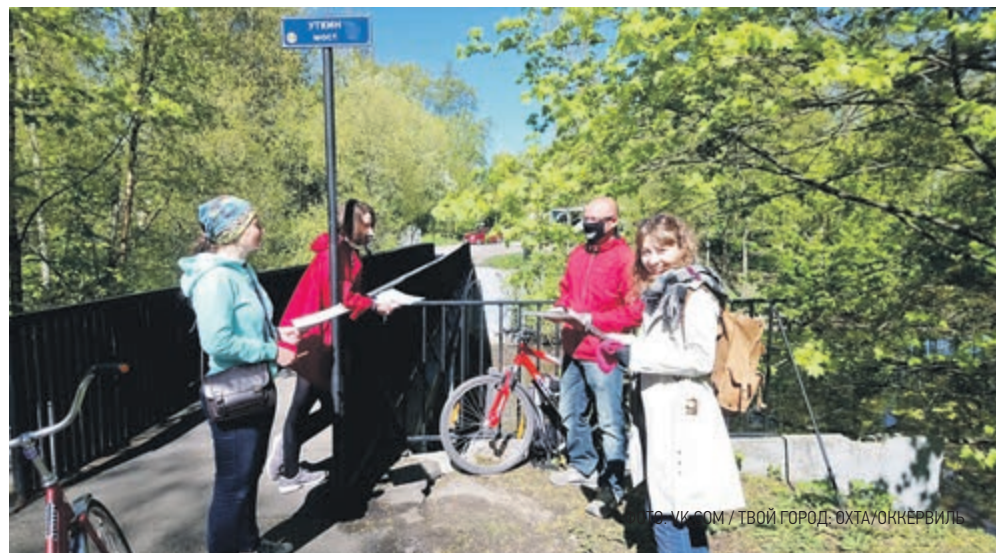
ФОТО: ИКОМ / ТВОЙ ГОРОД: ОХТА/ОККЕРВИЛЬ

«Мы надеемся, что все пройдет успешно, – подчеркнул он. – Соучаствующее проектирование – это следующий уровень после общественных слушаний, потому что обсуждение проекта жителями начинается, когда проекта еще нет. Людям уже недостаточно, чтобы их просто спро-