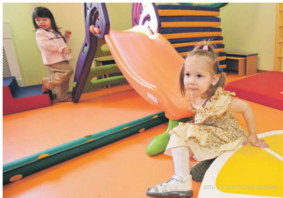
ФОТО: СПЕЦИАЛЬНЫЙ ДНЕВНИК

➤ С 31 мая введена в эксплуатацию выделенная полоса по маршруту, соединяющему четыре района города – Кировский, Московский, Фрунзенский и Невский. Она идет от перекрестка Народной улицы и Дальневосточного проспекта до перекрестка Ленинского проспекта и проспекта Народного Ополчения. Протяженность полосы – 6,8 километра. В Комитете по развитию транспортной инфраструктуры Санкт-Петербурга планируют увеличивать число выделенных полос.