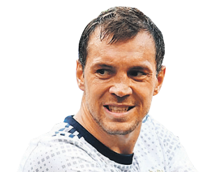
АРТЕМ ДЗЮБА, СБОРНАЯ РОССИИ

Мы вам говорим, а вы не верите. Хотим совершить чудо. Аппетит приходит во время еды. Мы хотим дальше. Хорватия вообще топ, но и Испания была топ. В одной игре на родной земле любая команда может победить любую.