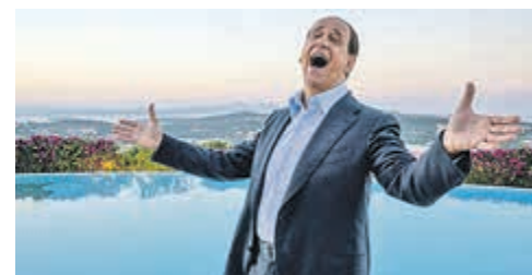
«Лоро», режиссер Паоло Соррентино