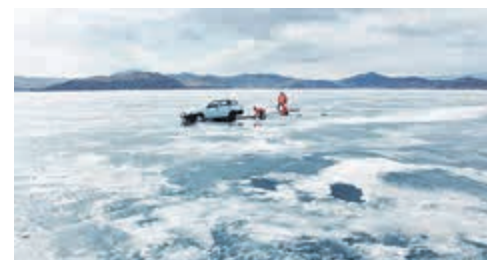
«Акварель», режиссер Виктор Косаковский