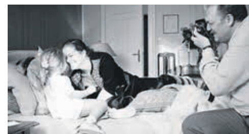
«Три дня с Роми Шнайдер», режиссер Эмили Атеф