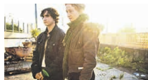
«Счастливым Лазарь», режиссер Аличе Рорвахер