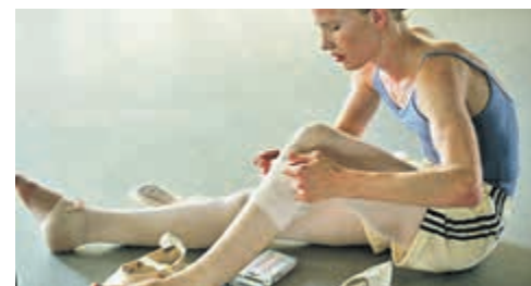
«Девочка», режиссер Лукас Донт