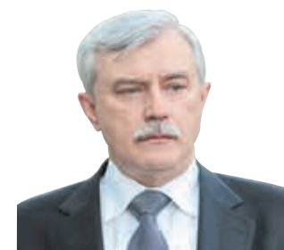
ГЕОРГИЙ ПОЛТАВЧЕНКО, ГУБЕРНАТОР САНКТ-ПЕТЕРБУРГА

Необходимо повысить эффективность совместной работы по пресечению незаконного изготовления и продажи алкоголя.