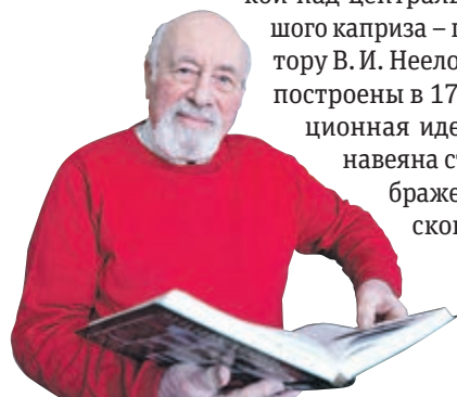
Большой каприз овеян и другими легендами.