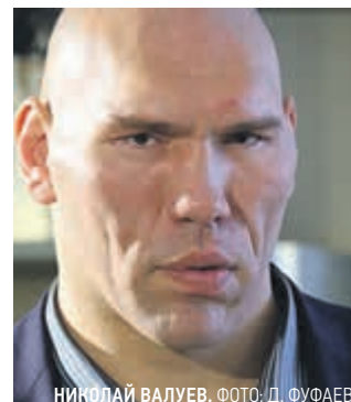
НИКОЛАЙ ВАЛУЕВ.