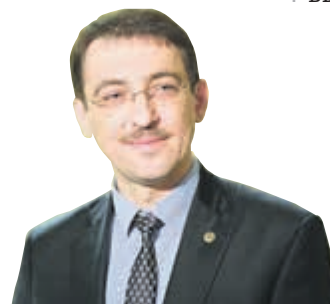
МИХАИЛ ДУБИНА, ПРЕДСЕДАТЕЛЬ КОМИТЕТА ПО ЗДРАВООХРАНЕНИЮ

Врачи с нетерпением ждут, когда в 2020 г. начнется переход всех медучреждений в подчинение Комитету по здравоохранению. Это поможет объединить задачи, стоящие перед медиками.