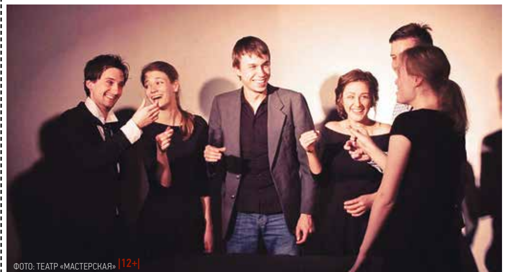
ФОТО: ТЕАТР «МАСТЕРСКАЯ» |12+