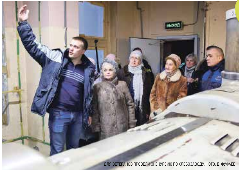
ДЛЯ ВЕТЕРАНОВ ПРОВЕЛИ ЭКСКУРСИЮ ПО ХЛЕБОЗАВОДУ.

«Мне кажется очень символичным, что акция стартует именно на этом предприятии, – отметил председатель Комитета по печати и взаимодействию со СМИ Сергей Серезлеев. – Ленинградский комбинат хлебопродуктов – это один из примеров героизма жителей при защите города. Сотрудники завода умирали от голода, но не позволяли