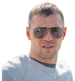
АРТЕМ ДЗЮБА, НАПАДАЮЩИЙ «ЗЕНИТА»

У меня еще год контракта, многое зависит от руководства «Зенита». Было бы правильно, чтобы предложили продление, потому что не хочется сидеть и думать, будем продлевать или нет. Надеюсь, будет конкретика с Европой.