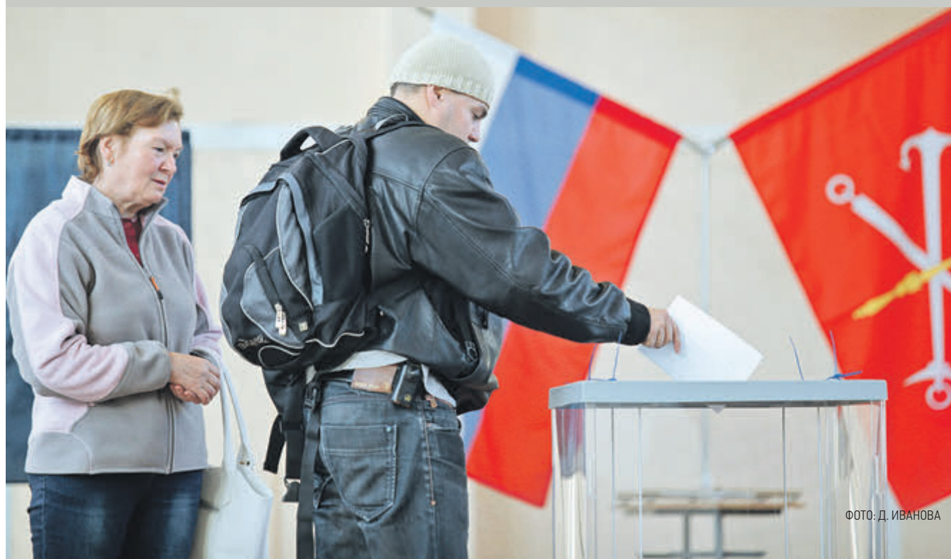
ФОТО: Д. ИВАНОВА