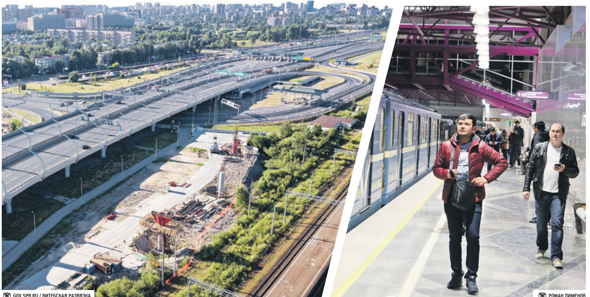
ВИТЕБСКАЯ РАЗВЯЗКА