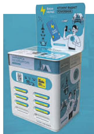
СПБ ГБУ «ГТИБ»

➤ Туристы и жители города с сентября нынешнего года смогут воспользоваться прокатом устройств для зарядки смартфонов. Как сообщается на портале Visit-Petersburg.ru, проект будет запущен в несколько этапов. Сначала взять пауэрбанк можно будет в офисах и павильонах Городского туристско-информационного бюро, затем подобные автоматы появятся в тех местах, где расположены основные городские достопримечательности.