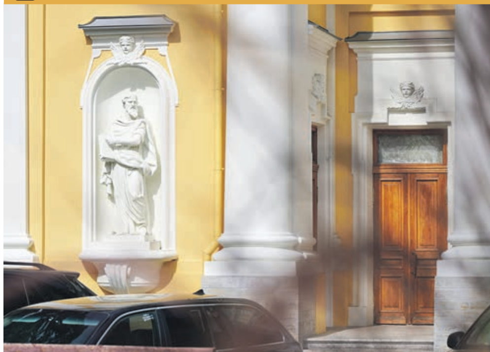
ФОТО ДНЯ / РЕСТАВРАТОРЫ НАВЕЛИ КРАСОТУ СВЯТОЙ ЕКАТЕРИНЕ

Кроме того, постамент памятника долгое время воспринимался как единая скала. Сейчас очевидно, что гром-камень состоит из трех крупных блоков и двух небольших. Раньше они были притесаны друг к другу, а сегодня идет их расползание. Поэтому, объяснили в Государственном музее городской скульптуры, реставрация стала необходимостью.