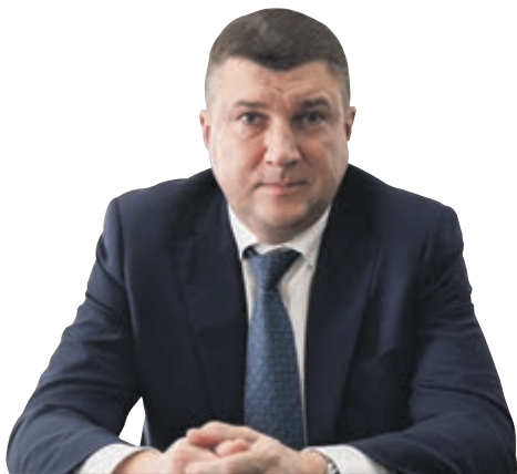
ДМИТРИЙ КОПТИН Председатель Комитета по тарифам Санкт-Петербурга

В системе жилищно-коммунального хозяйства очень многое зависит от инициативы и контроля со стороны самих собственников. И речь не только о благоустроенности дома, исправности всех систем и чистоте в парадных. Мы с вами можем непосредственно повлиять и на сумму в ежемесячных квитанциях. Как сделать это?