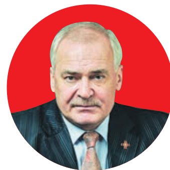
НИКОЛАЙ БУРОВ /народный артист России/