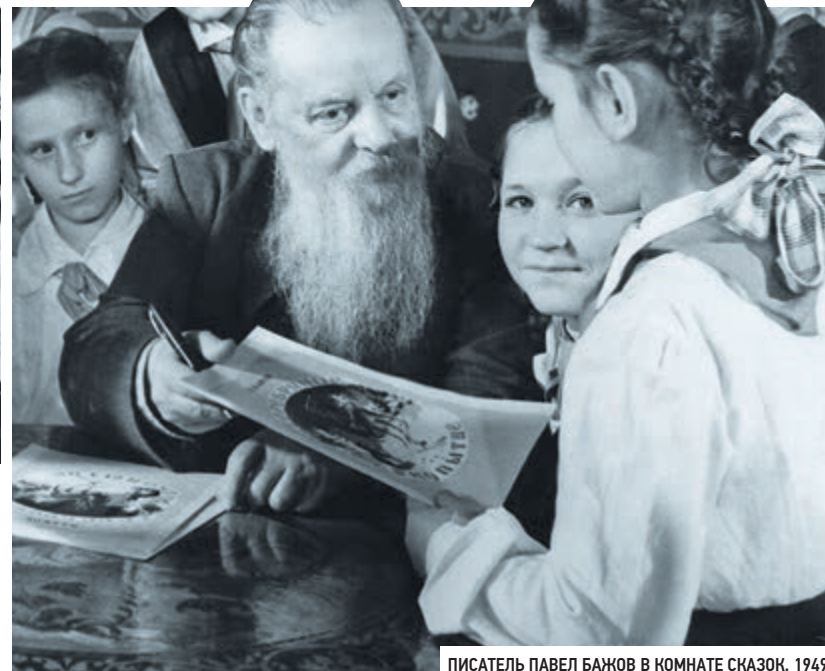
ПИСАТЕЛЬ ПАВЕЛ БАЖОВ В КОМНАТЕ СКАЗОК. 1949