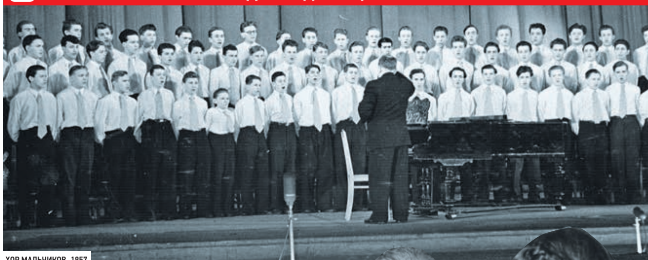
ХОР МАЛЬЧИКОВ. 1957