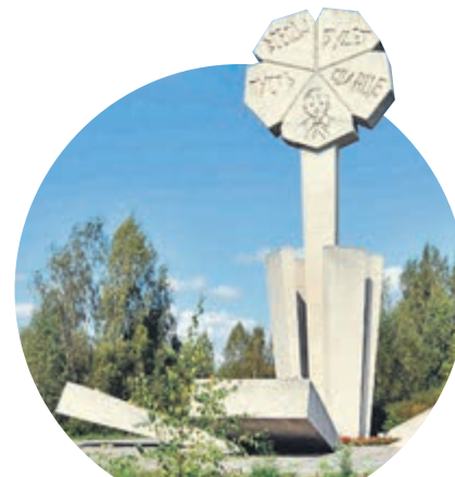
МЕМОРИАЛ «ЦВЕТОК ЖИЗНИ»

Девятнадцатого мая 1962 года было торжественно открыто новое здание Ленинградского театра юных зрителей. Он находится на Пионерской площади, которая получила свое название в том же году.