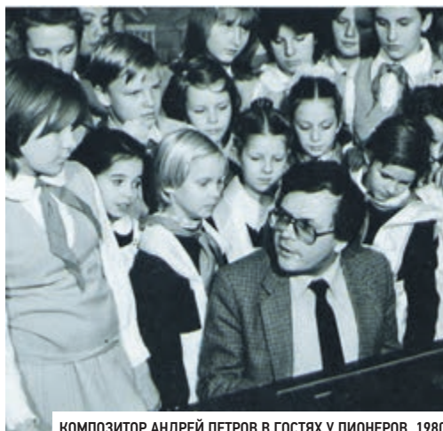
КОМПОЗИТОР АНДРЕЙ ПЕТРОВ В ГОСТЯХ У ПИОНЕРОВ. 1980