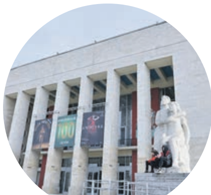
ТЕАТР ЮНЫХ ЗРИТЕЛЕЙ ИМ. А. А. БРЯНЦЕВА

На карте города насчитывается много точек, связанных с пионерией, – это площади, улицы, памятники... Многие из них появились в те годы, когда отмечались юбилеи со дня создания пионерской организации.