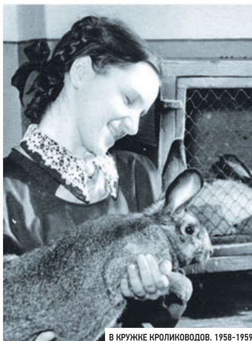
В КРУЖКЕ КРОЛИКОВОДОВ. 1958-1959