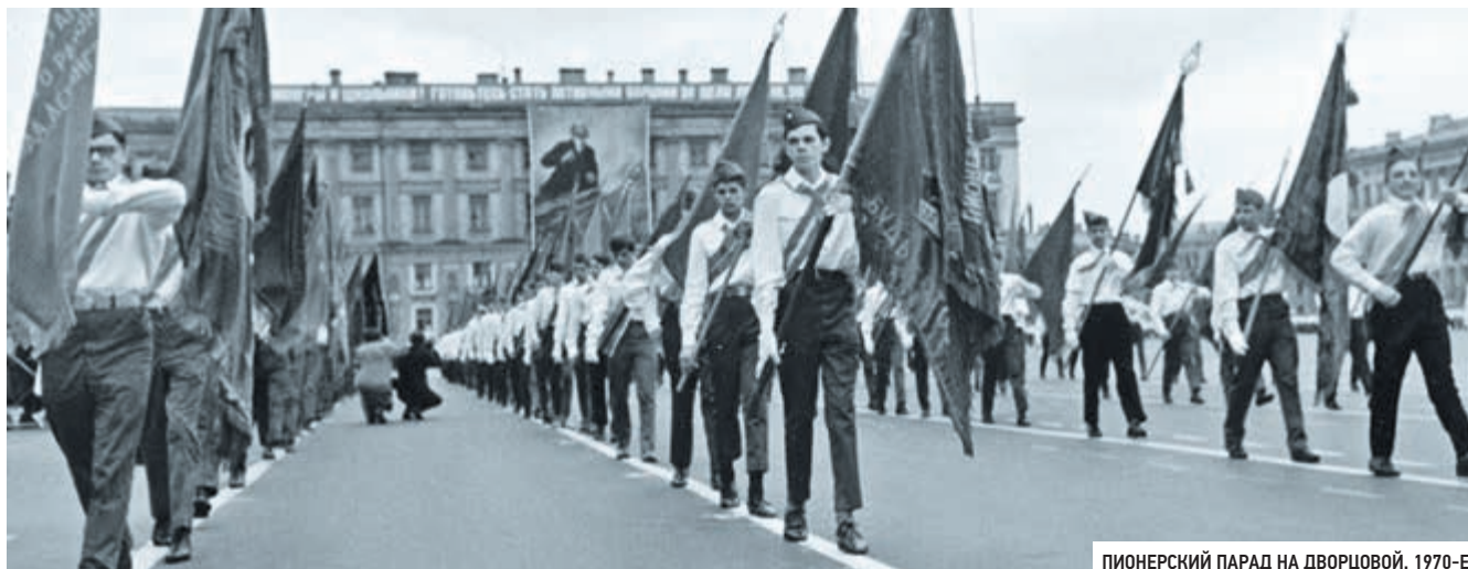
ПИОНЕРСКИЙ ПАРАД НА ДВОРЦОВОЙ. 1970-Е