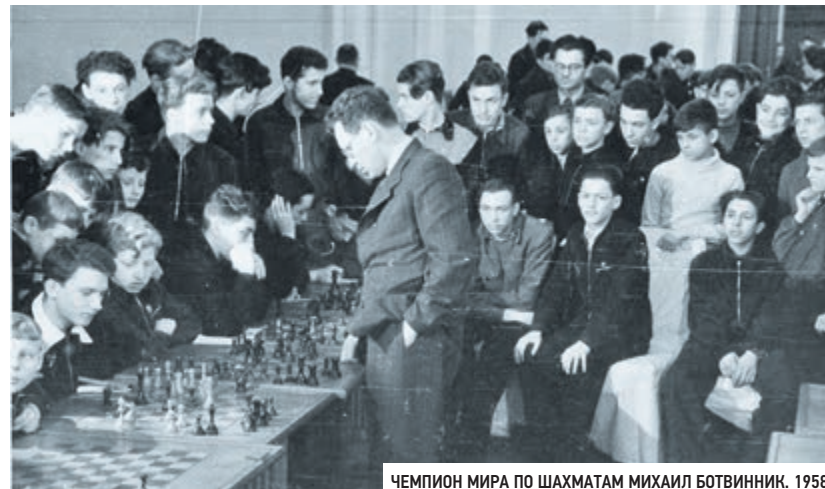
ЧЕМПИОН МИРА ПО ШАХМАТАМ МИХАИЛ БОТВИННИК. 1958