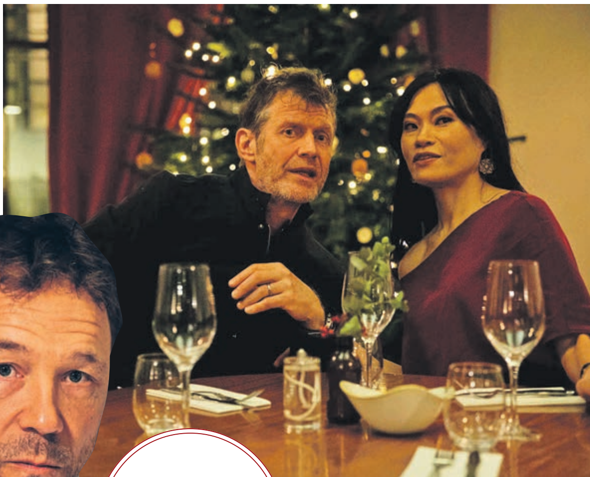
Актер Стивен Грэм снялся в 116 фильмах, в четырех выступил в качестве продюсера.