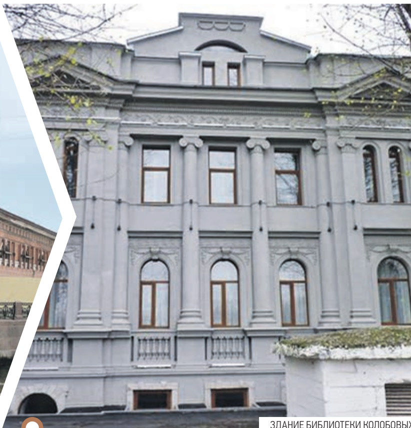
ЗДАНИЕ БИБЛИОТЕКИ КОЛОБОВЫХ