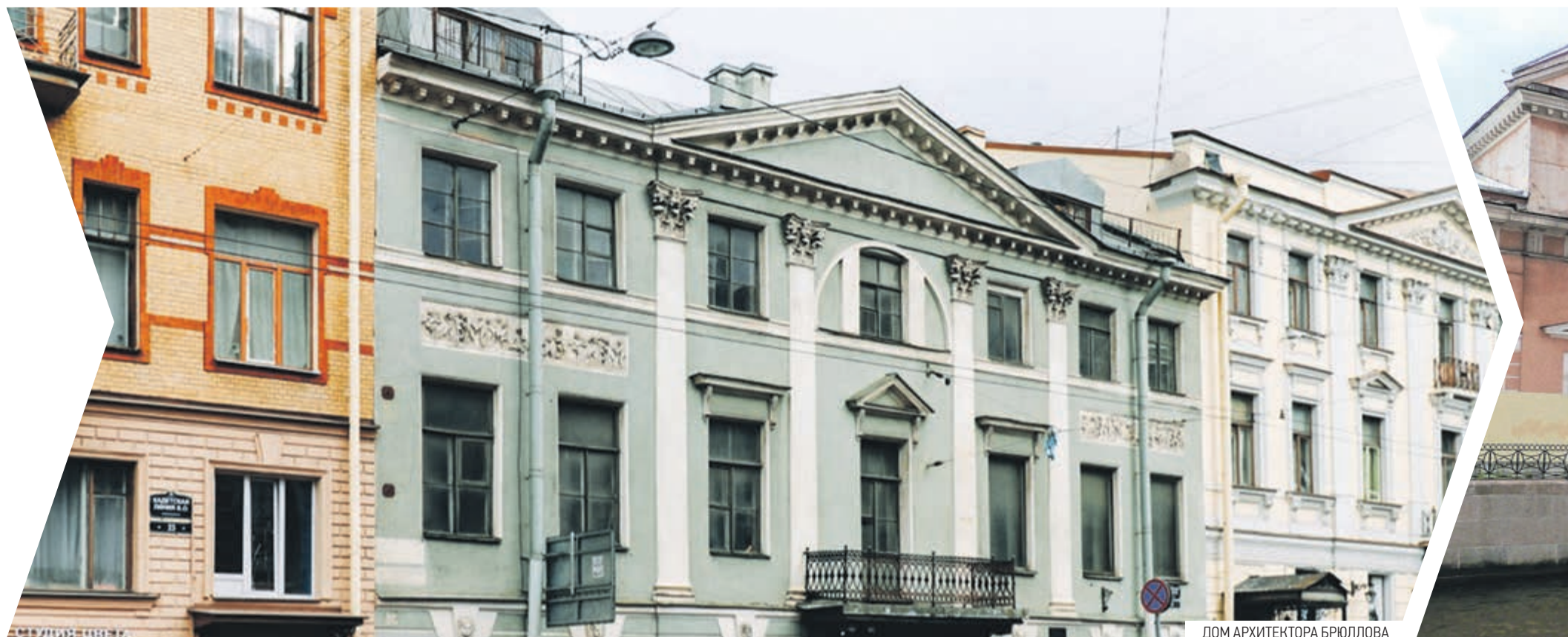
ДОМ АРХИТЕКТОРА БРЮЛЛОВА

Чтобы участвовать в аукционе, потенциальный пользо-