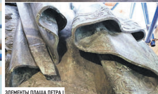
ЭЛЕМЕНТЫ ПЛАЩА ПЕТРА