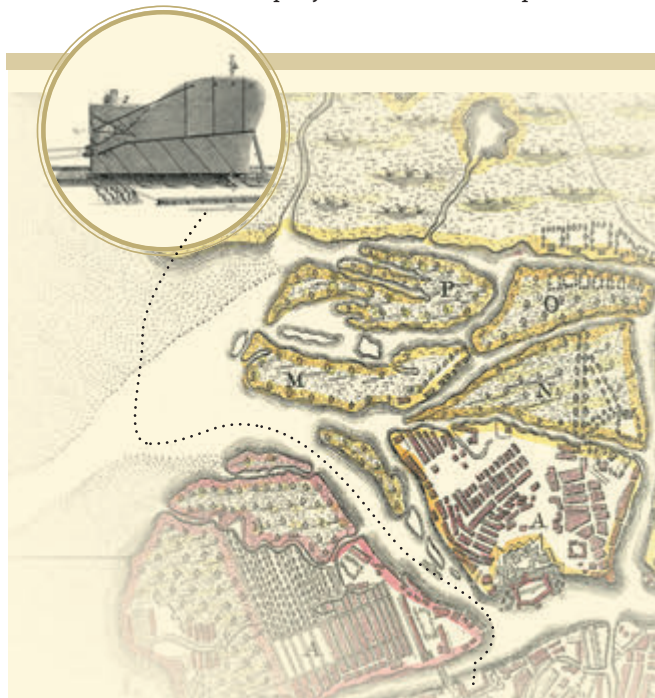
Путь движения Гром-камня из Лакты к Сенатской площади

В Петербург привезены и мастерски обработаны прекрасные образцы самых разных горных пород. Это постаменты памятников, колонны соборов, цокольные этажи зданий... Изучать архитектурные шедевры как экспонаты огромного геологического музея и делиться своими знаниями – приятная привилегия специалистов-геологов, считает Георгий Попов.