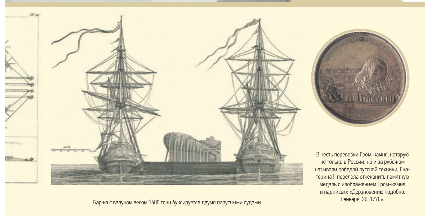
Баржа с валуном весом 1600 тонн буксируется двумя парусными судами

Точка зрения обозревателей может не совпадать с мнением редакции.