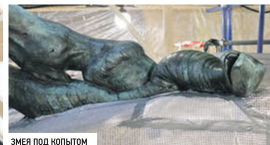
ЗМЕЯ ПОД КОПЫТОМ