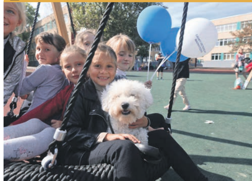
ФОТО ДНЯ / ГОРОД-ПОБРАТИМ ВОЗВРАЩАЕТСЯ К МИРНОЙ ЖИЗНИ

Спасение людей в Донбассе является центром внимания России, этот вопрос стоит во главе угла, заявил президент России Владимир Путин. «Это естественно, потому что связано и с драматическими событиями», – сказал глава государства на совещании, посвященном ходу полевых работ. Отметим, что суммарный сбор зерна в России в этом году может составить рекордные 150 миллионов тонн.