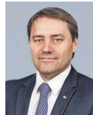
АЛЕКСАНДР БЕЛЬСКИЙ, председатель Законодательного собрания Санкт-Петербурга