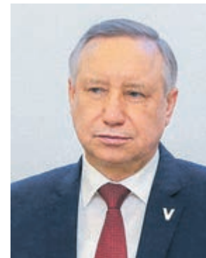
АЛЕКСАНДР БЕГЛОВ, губернатор Санкт-Петербурга