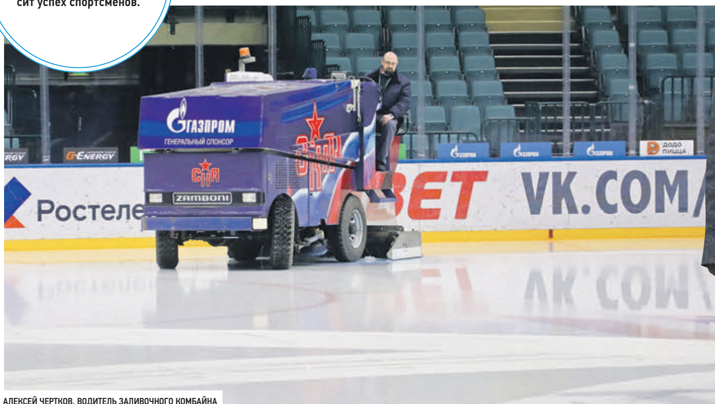
АЛЕКСЕЙ ЧЕРТКОВ, ВОДИТЕЛЬ ЗАЛИВОЧНОГО КОМБАЙНА

От качества ледового покрытия, от мастерства ледоваров напрямую зависит успех спортсменов.