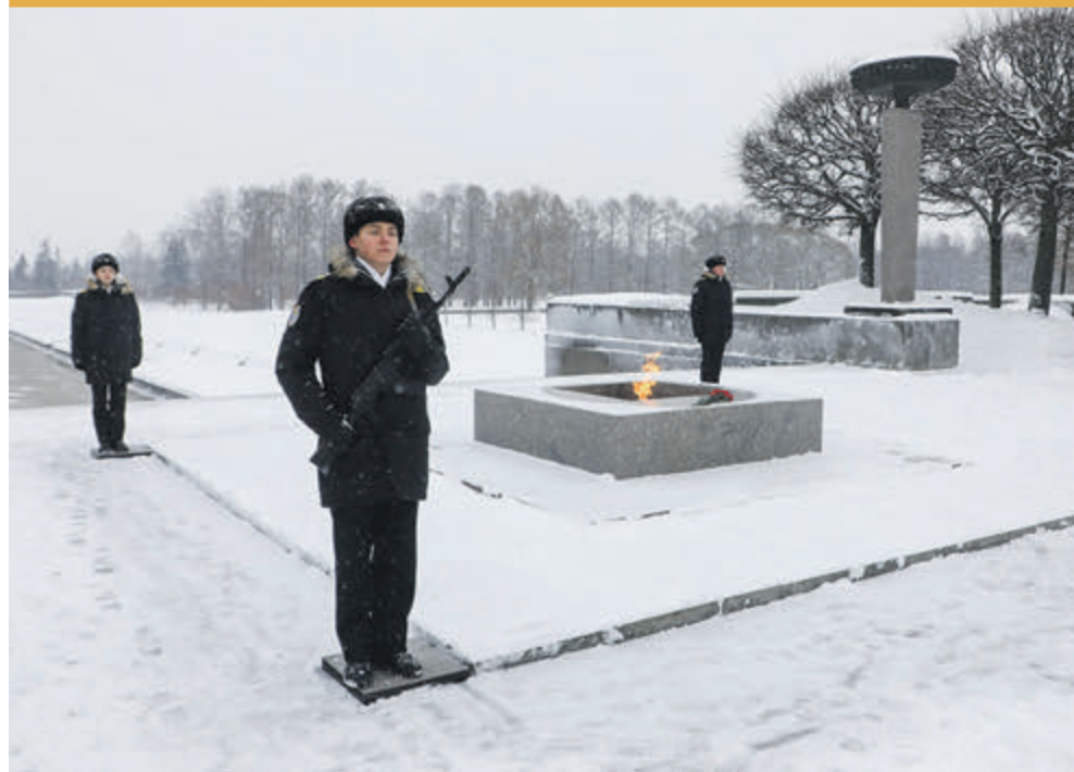
ФОТО ДНЯ / МОЛОДЫЕ ПЕТЕРБУРЖЦЫ ЗАСТУПИЛИ НА ПОСТ

экспресс», транспортные новинки российско-китайского производства и многое другое. Весь транспорт – низкопольный, при выборе моделей это было обязательным условием города.