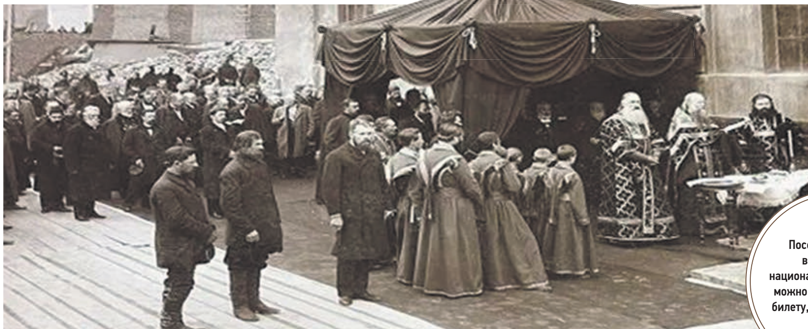
ЗАКЛАДКА ВОРОТИЛОВСКОГО КОРПУСА ИМПЕРАТОРСКОЙ БИБЛИОТЕКИ. 1896 Г.

ЧИТАЙТЕ В ПЯТНИЦУ: КАК «ПЕТЕРБУРГСКИЙ ДНЕВНИК» СНИМАЛ ФИЛЬМ ПРО КИНОТЕАТР «АВРОРА»