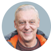
АЛЕКСАНДР ПОЛОВЦЕВ, ЗАСЛУЖЕННЫЙ АРТИСТ РФ

«Если в этом году меня пригласит кто-то из священнослужителей искупаться в крещенской проруби, то я с радостью соглашусь. Пару лет назад я искупался в Озерках три раза. От самого купания в проруби дух захватывает. Это достаточно острые ощущения».