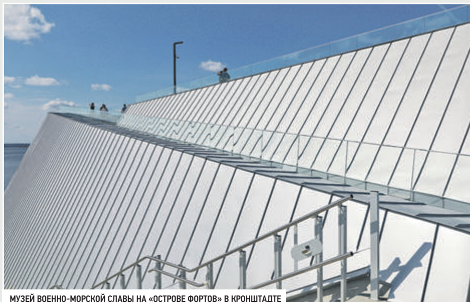
МУЗЕЙ ВОЕННО-МОРСКОЙ СЛАВЫ НА «ОСТРОВЕ ФОРТОВ» В КРОНШТАДТЕ