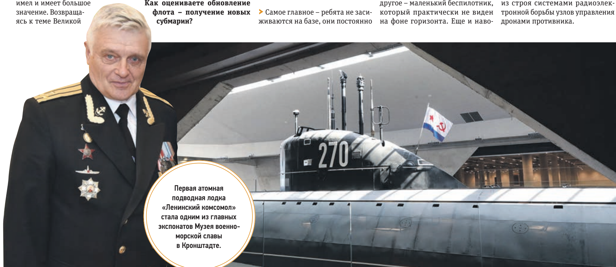
Первая атомная подводная лодка «Ленинский комсомол» стала одним из главных экспонатов Музея военно-морской славы в Кронштадте.

Бортовое вооружение надводных кораблей и другие средства будут усилены, это очевидно. Важную роль тут играет и выведение из строя системами радиоэлектронной борьбы узлов управления дронами противника.