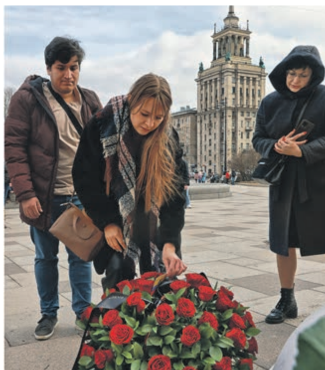
ПЛОЩАДЬ ПЕРЕД РОССИЙСКОЙ НАЦИОНАЛЬНОЙ БИБЛИОТЕКОЙ.