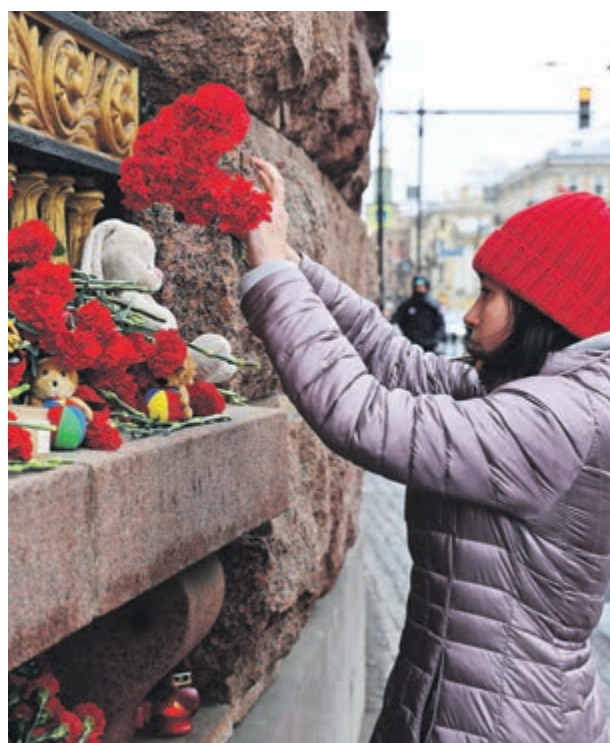
СТАНЦИЯ МЕТРО «ТЕХНОЛОГИЧЕСКИЙ ИНСТИТУТ».