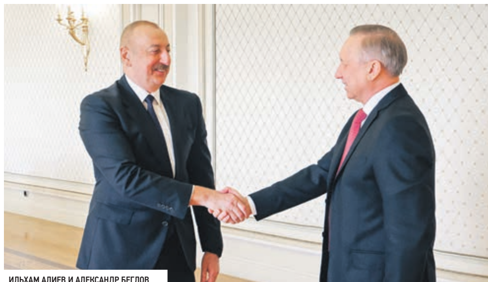
ИЛЬХАМ АЛИЕВ И АЛЕКСАНДР БЕГЛОВ

«Убежден, что смелость, новаторство и глубокая преданность Родине выдающегося ленинградца отвечают духу современного Баку. Азербайджан и Петербург связы-