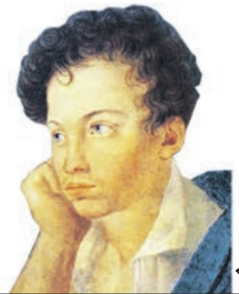
С. Г. ЧИРИКОВ. «ПУШКИН-ЛИЦЕИСТ». РИСУНОК

ИЗДАНИЕ ПРАВИТЕЛЬСТВА САНКТ-ПЕТЕРБУРГА ■ SPBDNEVNIK.RU ■ SPBDNEVNIK ■ DNEVNIKSPB ■ @SPB.DNEVNIK ■ ПЕТЕРБУРГСКИЙДНЕВНИК ■ @DNEVSPB