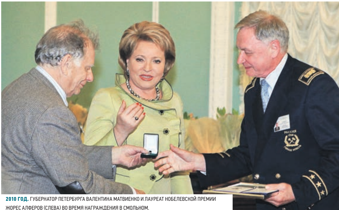
2010 ГОД. ГУБЕРНАТОР ПЕТЕРБУРГА ВАЛЕНТИНА МАТВИЕНКО И ЛАУРЕАТ НОБЕЛЕВСКОЙ ПРЕМИИ ЖОРЕС АЛФЕРОВ (СЛЕВА) ВО ВРЕМЯ НАГРАЖДЕНИЯ В СМОЛЬНОМ.