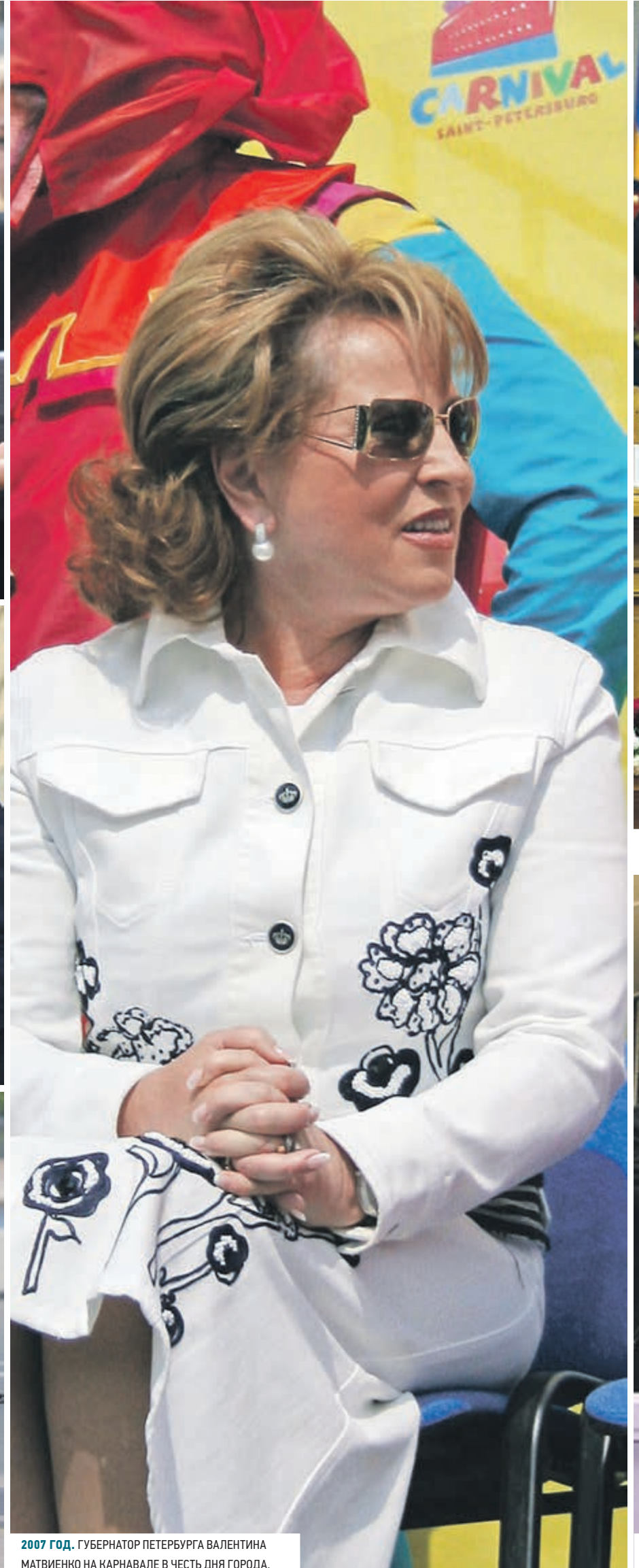
2007 ГОД. ГУБЕРНАТОР ПЕТЕРБУРГА ВАЛЕНТИНА МАТВИЕНКО НА КАРНАВАЛЕ В ЧЕСТЬ ДНЯ ГОРОДА.