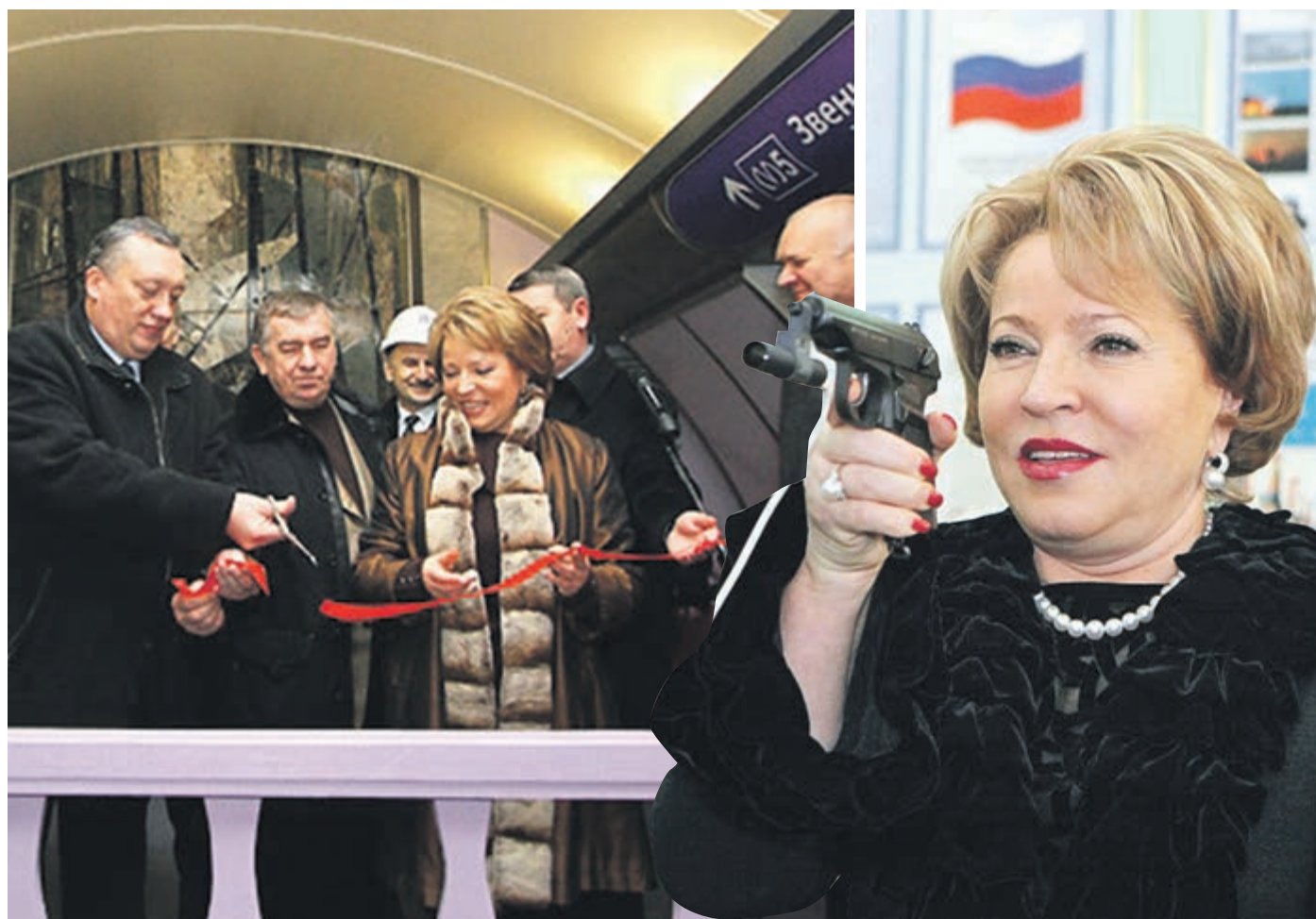
2008 ГОД. ГУБЕРНАТОР ПЕТЕРБУРГА ВАЛЕНТИНА МАТВИЕНКО НА ТОРЖЕСТВЕННОМ ОТКРЫТИИ СТАНЦИИ МЕТРО «ВОЛКОВСКАЯ».