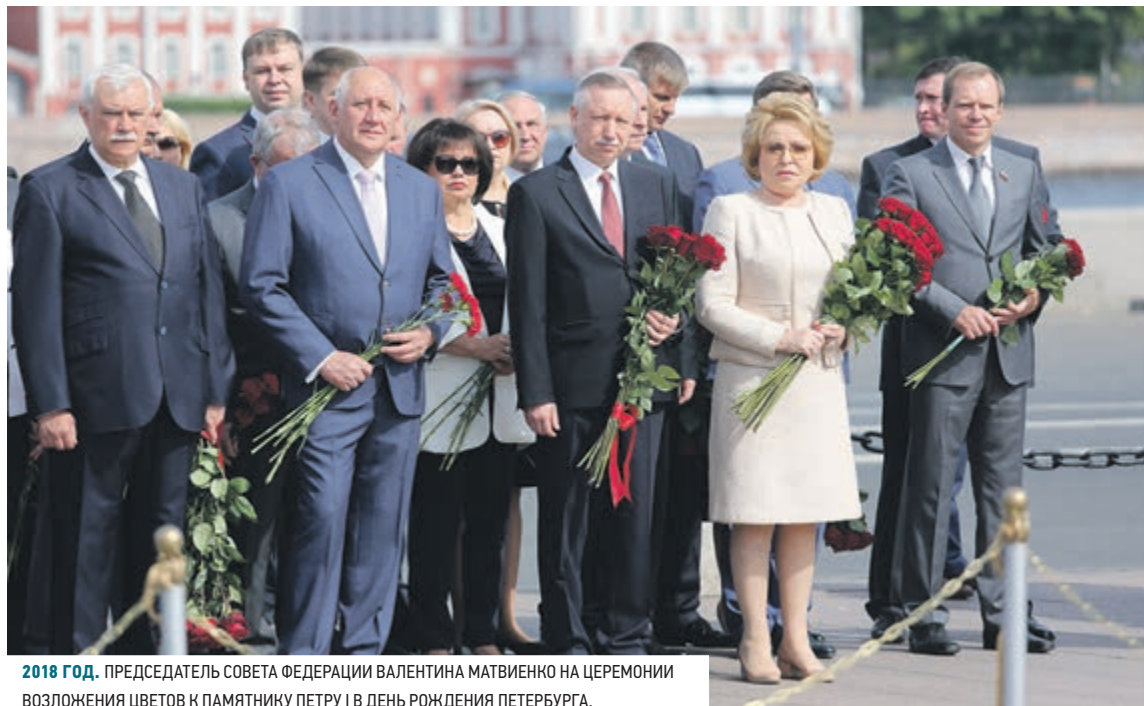
2018 ГОД. ПРЕДСЕДАТЕЛЬ СОВЕТА ФЕДЕРАЦИИ ВАЛЕНТИНА МАТВИЕНКО НА ЦЕРЕМОНИИ ВОЗЛОЖЕНИЯ ЦВЕТОВ К ПАМЯТНИКУ ПЕТРУ I В ДЕНЬ РОЖДЕНИЯ ПЕТЕРБУРГА.