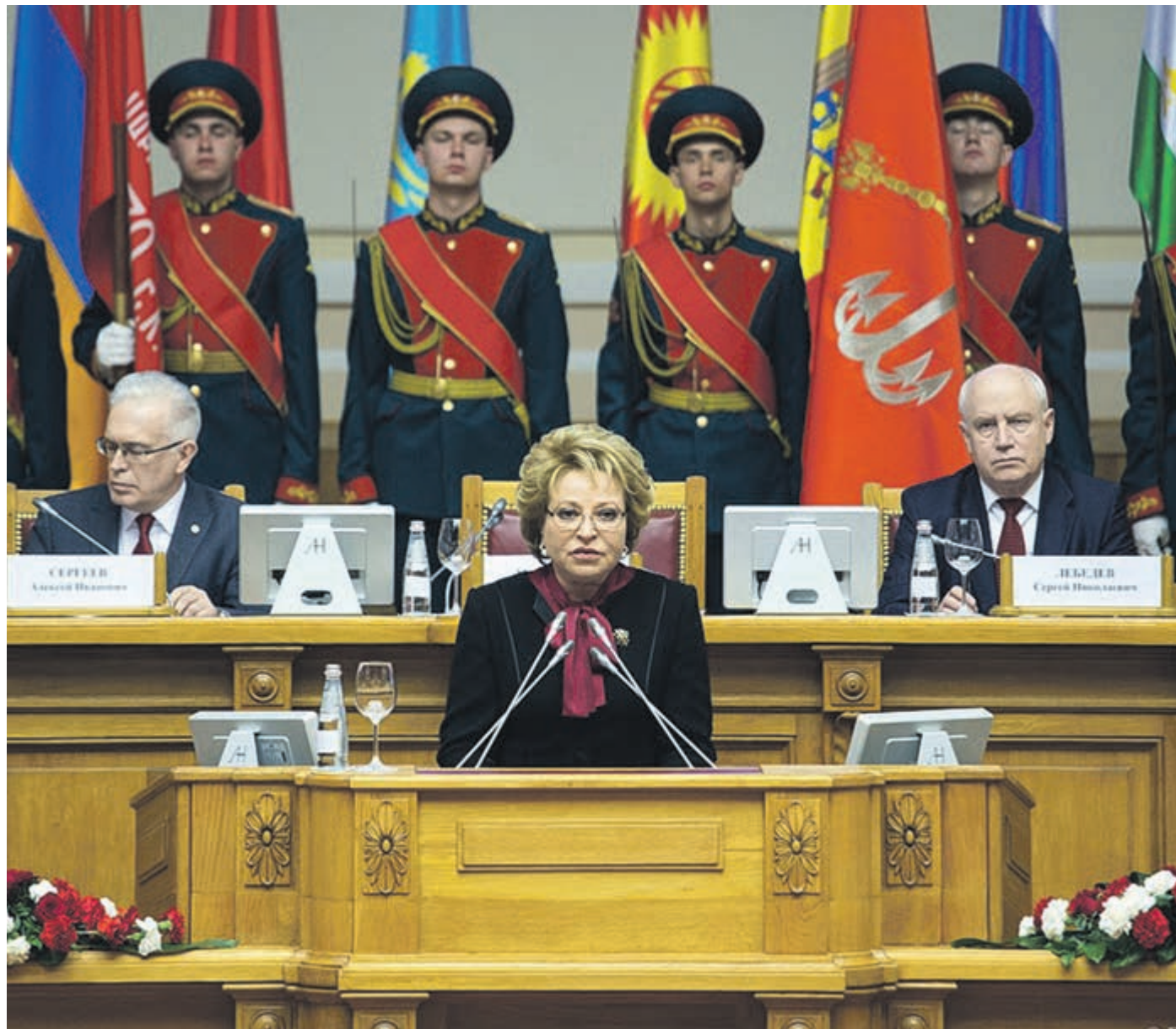
2015 ГОД. ВЫСТУПЛЕНИЕ СПИКЕРА СОВЕТА ФЕДЕРАЦИИ, ПРЕДСЕДАТЕЛЯ СОВЕТА МЕЖПАРЛАМЕНТСКОЙ АССАМБЛЕИ ГОСУДАРСТВ – УЧАСТНИКОВ СНГ ВАЛЕНТИНЫ МАТВИЕНКО В ТАВРИЧЕСКОМ ДВОРЦЕ НА ТОРЖЕСТВЕННОМ ЗАСЕДАНИИ АССАМБЛЕИ. ОНО БЫЛО ПОСВЯЩЕНО 70-ЛЕТИЮ ПОБЕДЫ В ВЕЛИКОЙ ОТЕЧЕСТВЕННОЙ ВОЙНЕ.