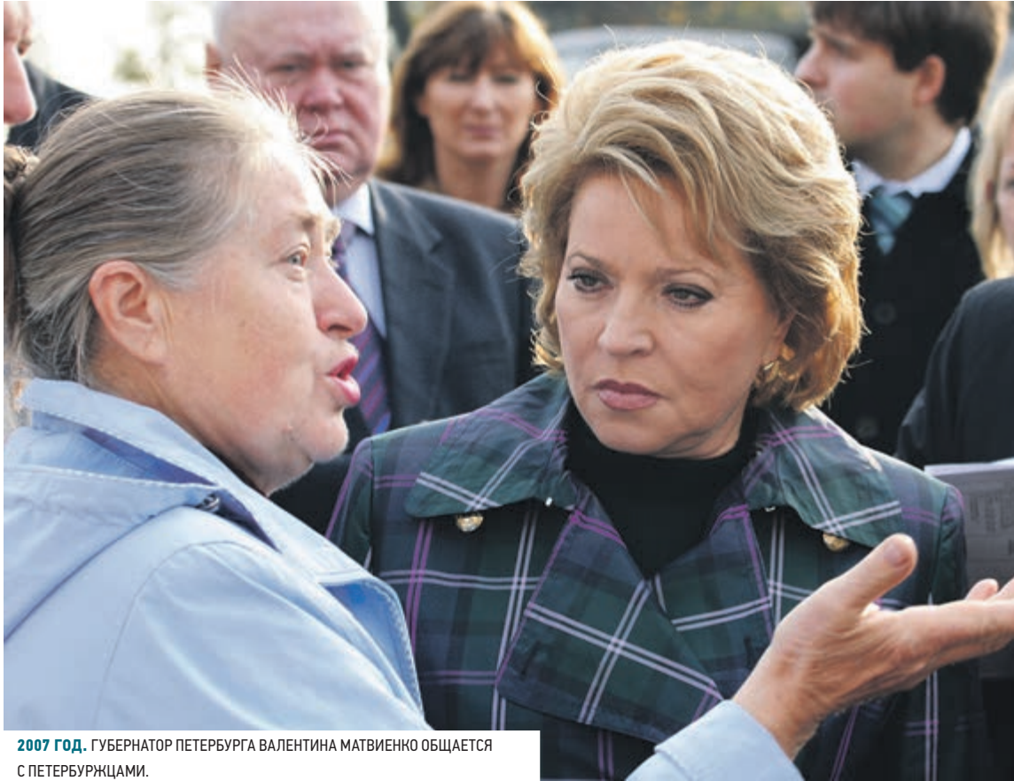
2007 ГОД. ГУБЕРНАТОР ПЕТЕРБУРГА ВАЛЕНТИНА МАТВИЕНКО ОБЩАЕТСЯ С ПЕТЕРБУРЖЦАМИ.