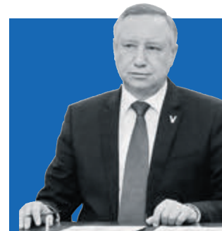
АЛЕКСАНДР БЕГЛОВ /ГУБЕРНАТОР САНКТ-ПЕТЕРБУРГА/

➤ Дорожные и садово-парковые предприятия возвращаются к весеннему режиму уборки после снегопада, который прошел в конце прошлой недели. «Мойка улиц возобновлена, уже в воскресенье расход воды на эти цели составил более 6 тысяч кубометров», – рассказали в Комитете по благоустройству Санкт-Петербурга.