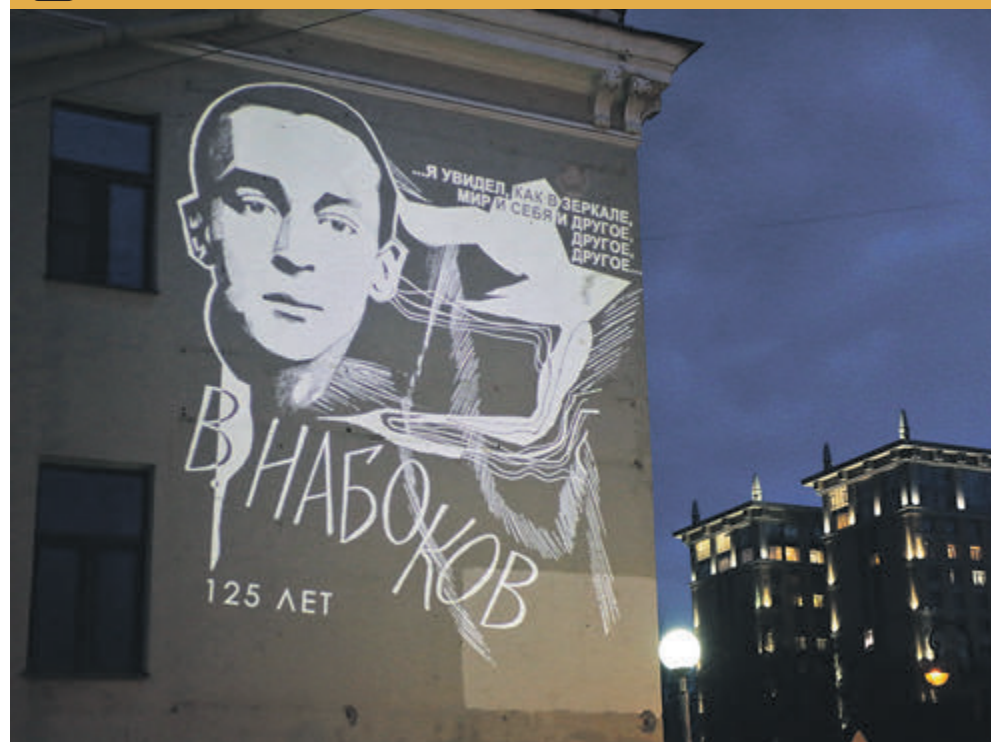
ФОТО ДНЯ / В ЦЕНТРЕ ГОРОДА «ПОДСВЕТИЛИ» НАБОКОВА

назад, в 2009 году, при подготовке к 65-й годовщине со дня полного освобождения города от блокады была впервые использована лента Ленинградской Победы.