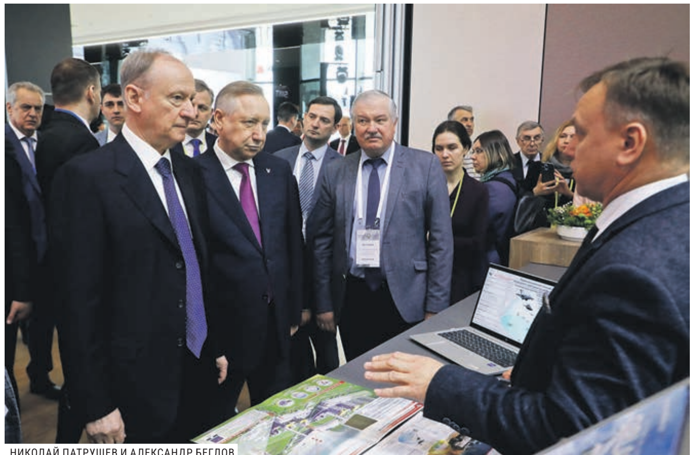
НИКОЛАЙ ПАТРУШЕВ И АЛЕКСАНДР БЕГЛОВ