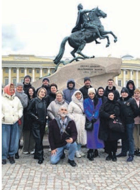
АКТЕРЫ ИЗ НОВОСИБИРСКА В ПЕТЕРБУРГЕ