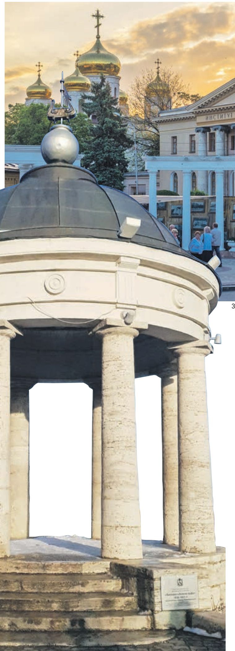
БЕСЕДКА «ЗОЛОВА АРФА»