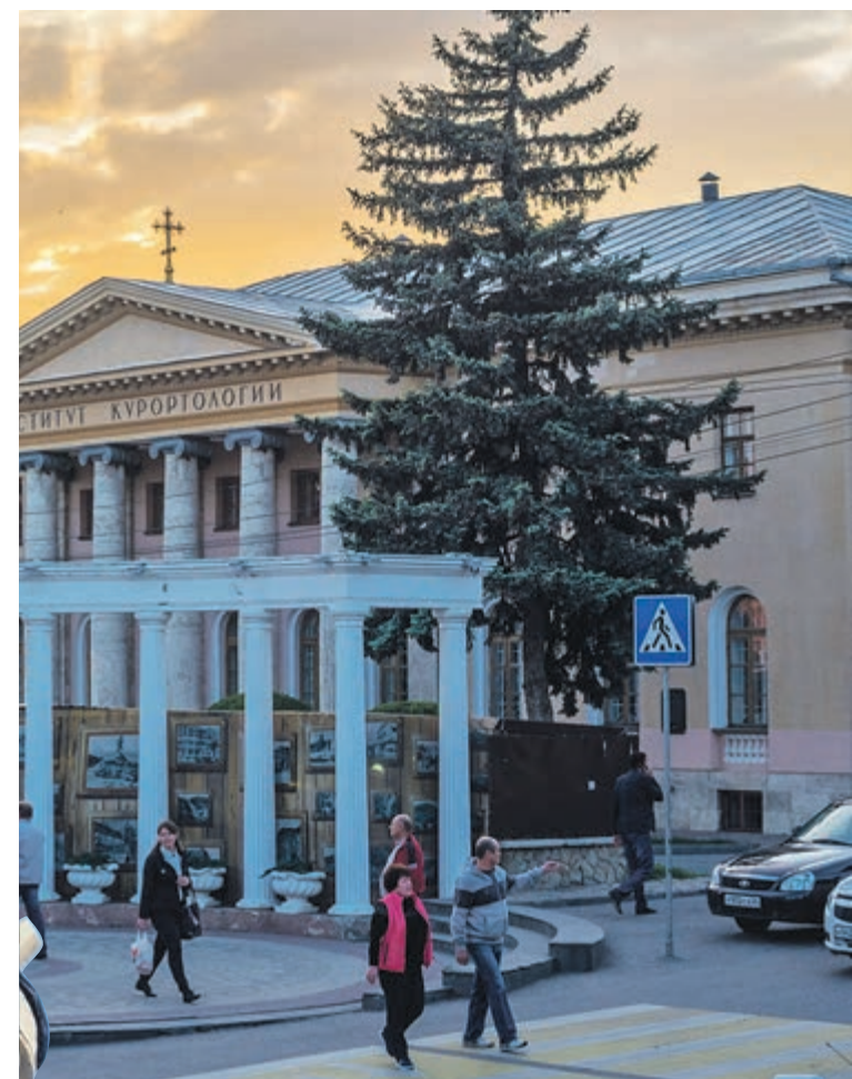
ЗДАНИЕ КАЗЕННОЙ РЕСТОРАЦИИ (СЕЙЧАС ИНСТИТУТ КУРОРТОЛОГИИ)

Сейчас в России реализуется проект «Пять морей» по созданию круглогодичных морских курортов. Одной из крупнейших составляющих проекта станет туристический кластер «Санкт-Петербург марина».