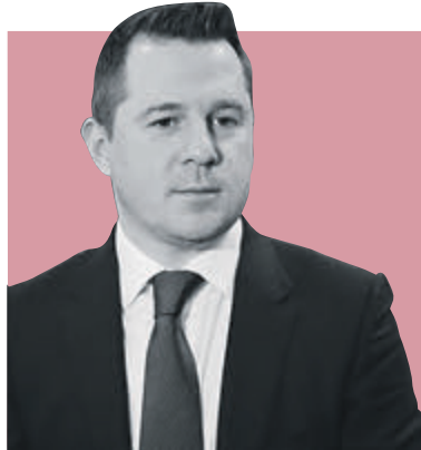
ФЕДОР БОЛТИН, ПРЕДСЕДАТЕЛЬ КОМИТЕТА ПО КУЛЬТУРЕ САНКТ-ПЕТЕРБУРГА