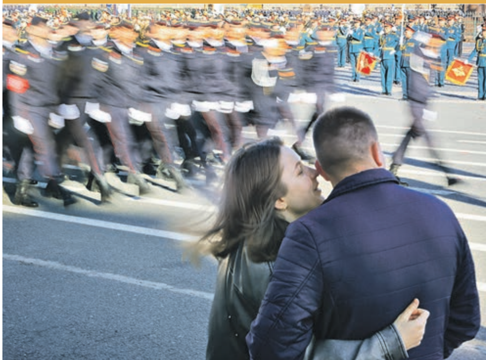
ФОТО ДНЯ / ВОЕННЫЕ ВЫШЛИ НА РЕПЕТИЦИЮ