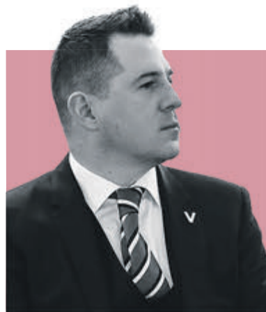
ФЕДОР БОЛТИН, ПРЕДСЕДАТЕЛЬ КОМИТЕТА ПО КУЛЬТУРЕ САНКТ-ПЕТЕРБУРГА