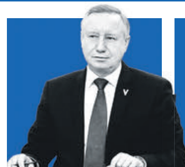
АЛЕКСАНДР БЕГЛОВ, губернатор Санкт-Петербурга

1,5 млн пенсионеров проживают в Петербурге к сегодняшнему дню, при этом 400 тысяч из них работают. Такие цифры озвучил губернатор президенту.