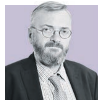
ВИТАЛИЙ МИЛОНОВ, депутат Государственной думы РФ

Губернатор Александр Беглов представил проект бюджета на три года. Эксперты одобрили направления, по которым предлагается развивать город.