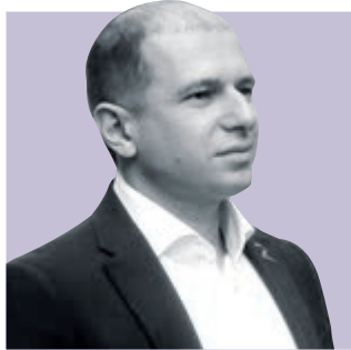
МИХАИЛ РОМАНОВ, депутат Государственной думы РФ

«Приятно, что за последние годы объем городской казны существенно вырос – в 2025 году он составит более 1,3 триллиона рублей. Это даст возможность Петербургу расширить свои социальные программы, закупить высококачественное оборудование для недавно построенных поликлиник, детских садов и школ».