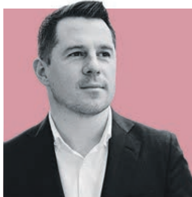
ФЕДОР БОЛТИН, председатель Комитета по культуре Санкт-Петербурга