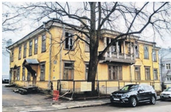
Так выглядел дом до начала нынешней реставрации.