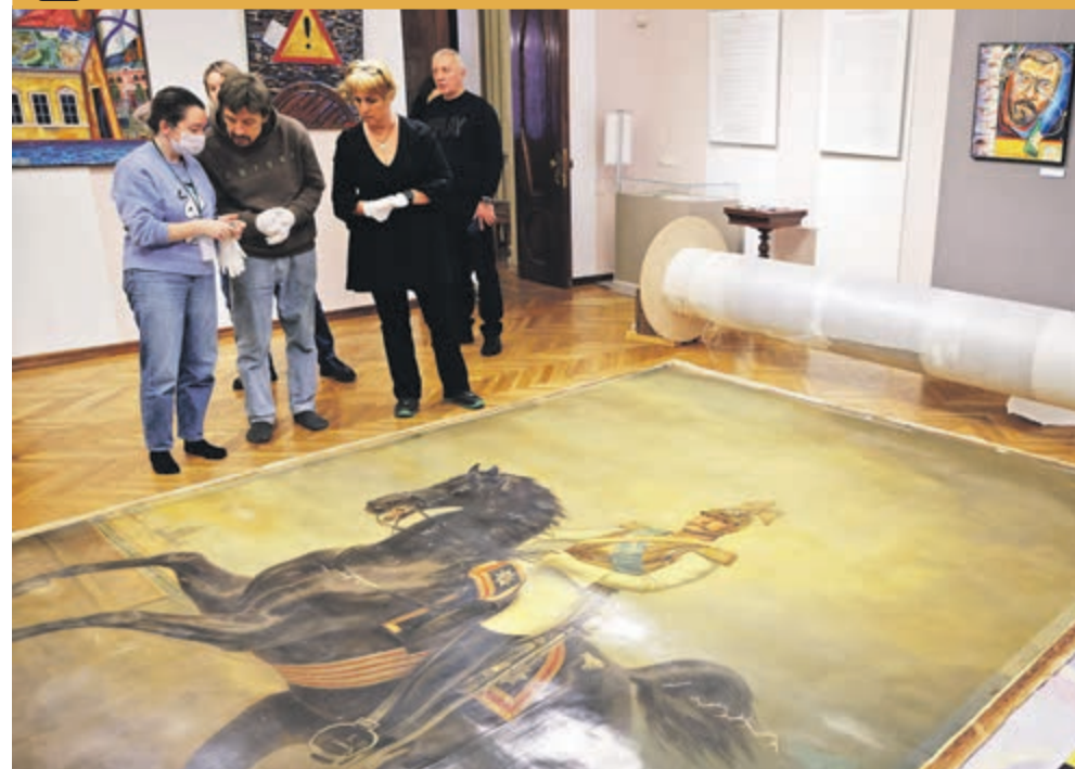
ФОТО ДНЯ / НИКОЛАЙ I СНОВА НА КОНЕ

«Сейчас проекты находятся в завершающей стадии – уже выполнено 90 процентов работ», – уточнили в администрации Петербурга.