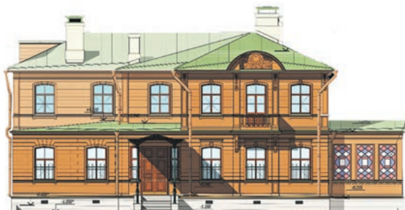
Таким станет памятник деревянного зодчества после реставрации.