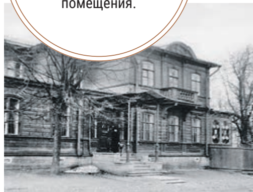
Исторический облик дома Вуича.

Большую часть будущего обновленного пространства музея займут выставочные помещения.