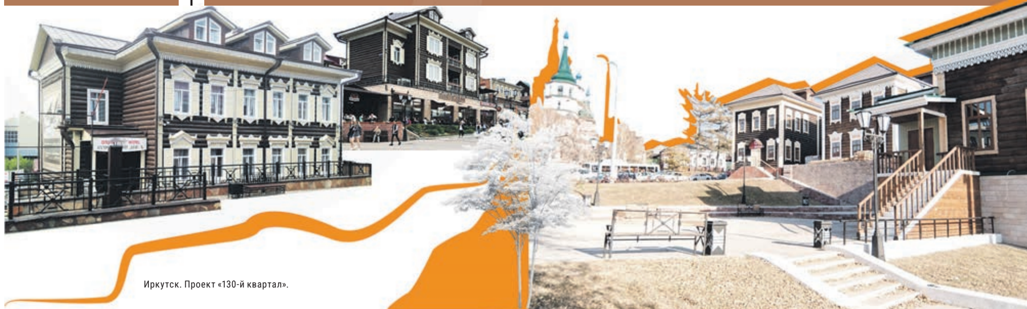
Иркутск. Проект «130-й квартал».