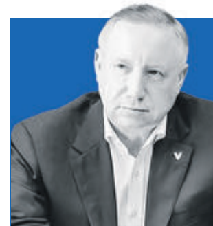
АЛЕКСАНДР БЕГЛОВ, губернатор Санкт-Петербурга

продлятся работы по возведению Большого Смоленского моста.