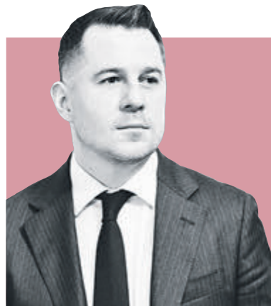
ФЕДОР БОЛТИН, председатель Комитета по культуре Санкт-Петербурга