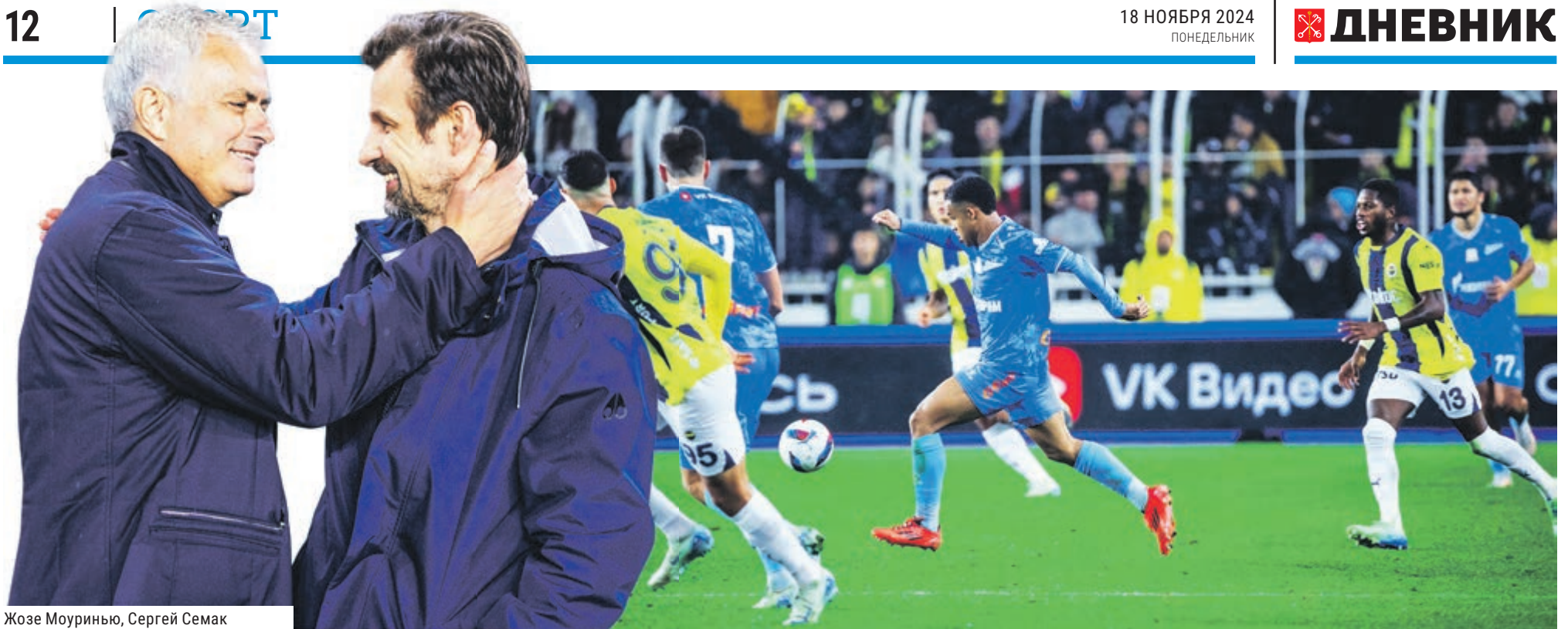
Жозе Моуринью, Сергей Семак