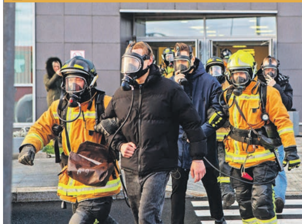
ФОТО ДНЯ / ОТРАБОТАЛИ КАК ПО-НАСТОЯЩЕМУ!

ОСОБОЕ ВНИМАНИЕ Губернатор также ознакомился с работой женской консультации № 19. По поручению Алексан-