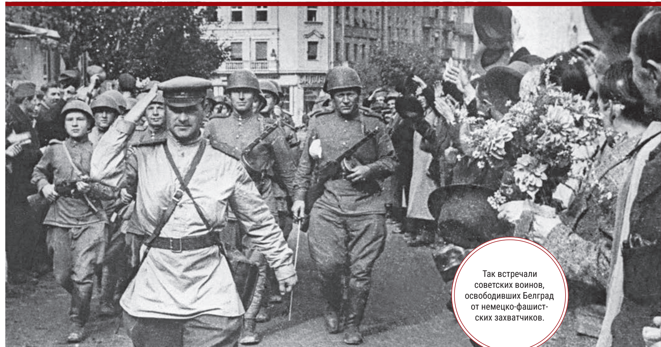
Так встречали советских воинов, освободивших Белград от немецко-фашистских захватчиков.

ный штаб этой силы возглавлял Иосип Броз Тито.