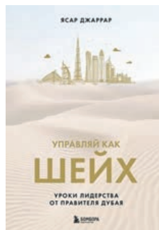
ИЗ ЛИЧНОГО АРХИВА ВАЛЕРИЯ ШАБАШОВА

VK.COM/MUSIC/PLAYLIST/-4423_6_4AE18800E34ACA7CF8, VK.COM/MUSIC/ALBUM/-2000459175_21459175_EA61BD8A21EF0D8129, VK.COM/MUSIC/ALBUM/-2000293783_22293783_F82C3453A7EE9BB9FF