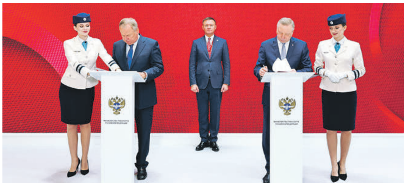
Андрей Костин, Роман Старовойт, Александр Беглов

✍ АВОР ТЕКСТА 🖼 АВОР ГРАФИКИ 📷 АВОР ФОТО 🖼 ИЗОБРАЖЕНИЕ ИЗ ФОТОБАНКА