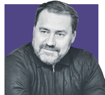
АЛЕКСАНДР БЕЛЬСКИЙ, председатель Законодательного собрания Санкт-Петербурга

ских оздоровительных лагерей. «Новые люди» поправками выделили 120 миллионов рублей на организацию физкультурно-спортивных мероприятий, 30 миллионов рублей – на традиционный фестиваль мотоциклов и мотоспорта. Фракция «Справедливая Россия» в бюджет включила 64 миллиона рублей на ремонт Таицкого водовода, питающего исторические пруды парков Павловска и Пушкина. По предложению КПРФ выделили 36 миллионов рублей на покупку для Елизаветинской больницы ультразвукового оборудования.