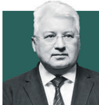
ОЛЕГ ЭРГАШЕВ, вице-губернатор Санкт-Петербурга

1 декабря отмечался Всемирный день борьбы со СПИДом.