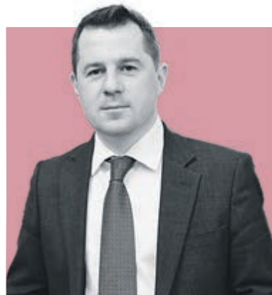
ФЕДОР БОЛТИН, председатель Комитета по культуре Санкт-Петербурга