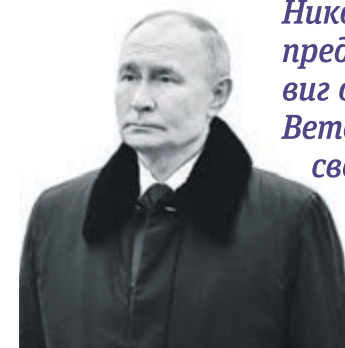
ПРЕЗИДЕНТ РОССИИ Владимир Путин – о 81-й годовщине полного освобождения Ленинграда от фашистской блокады

Никогда не будет предан забвению подвиг осажденного города. Ветераны оставили своим потомкам пример самоотверженности, милосердия и подлинного патриотизма.