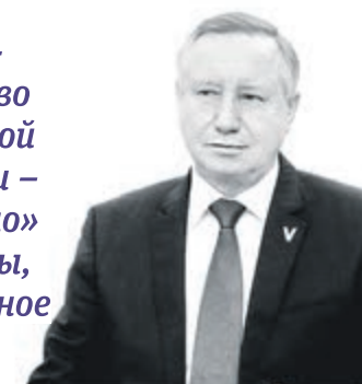
ГУБЕРНАТОР ПЕТЕРБУРГА Александр Беглов – о новой трамвайной линии «Купчино» – Шушары – Славянка

В этом году закончим строительство первого этапа новой трамвайной линии – от метро «Купчино» до поселка Шушары, включая трамвайное депо.