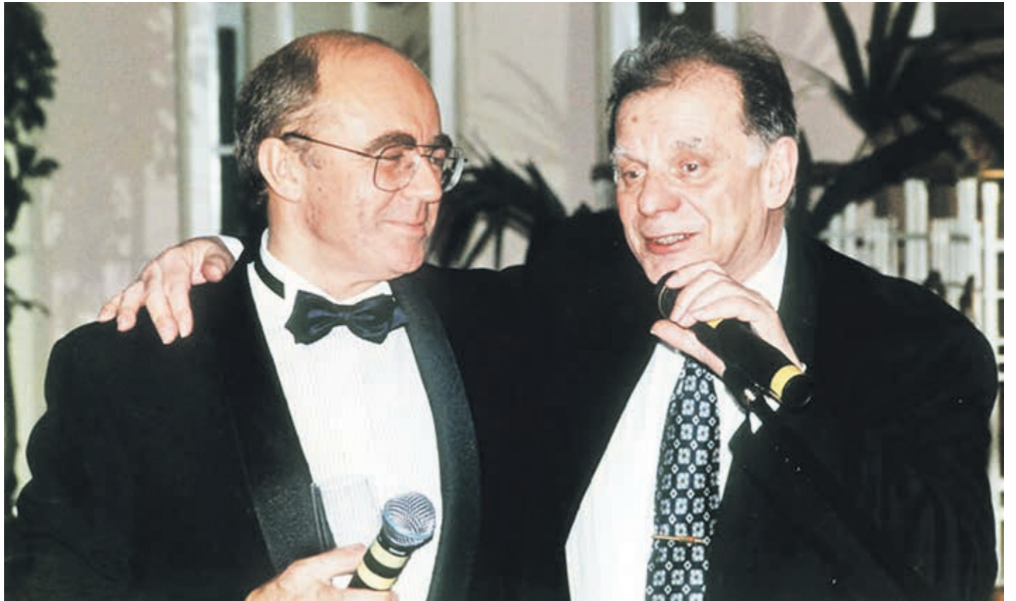
Александр Запесоцкий и Жорес Алферов в гранд-отеле «Европа».