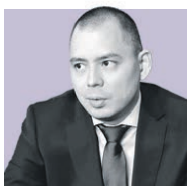
МАКСИМ ПОЛЕТАЕВ, исполняющий обязанности руководителя территориального органа – представителя МИД России в Санкт-Петербурге