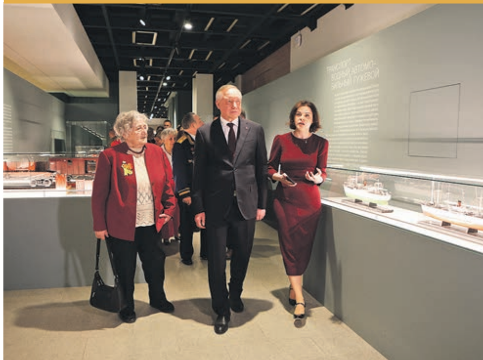
ФОТО ДНЯ / ВЫСТАВКА ПОКАЗАЛА ПОДВИГ ТЫЛА

К концу года город завершит строительство первой очереди автопарка на Ржевке и выведет на линию сотни электробусов.