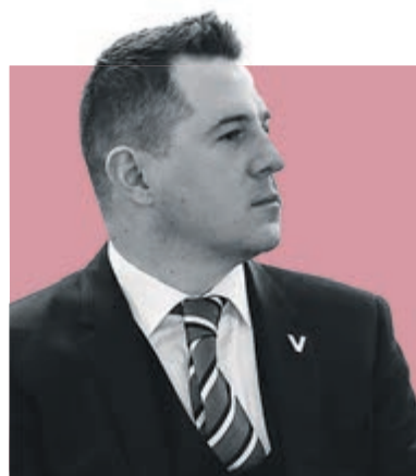
ФЕДОР БОЛТИН, председатель Комитета по культуре Санкт-Петербурга