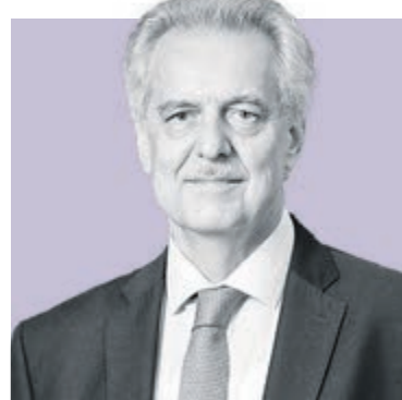
ЕВГЕНИЙ ГРИГОРЬЕВ, член правительства Санкт-Петербурга – председатель Комитета по внешним связям Санкт-Петербурга