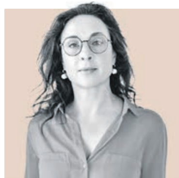
ЮЛИЯ САХАРОВА , директор платформы онлайн-рекрутинга hh.ru СЗФО