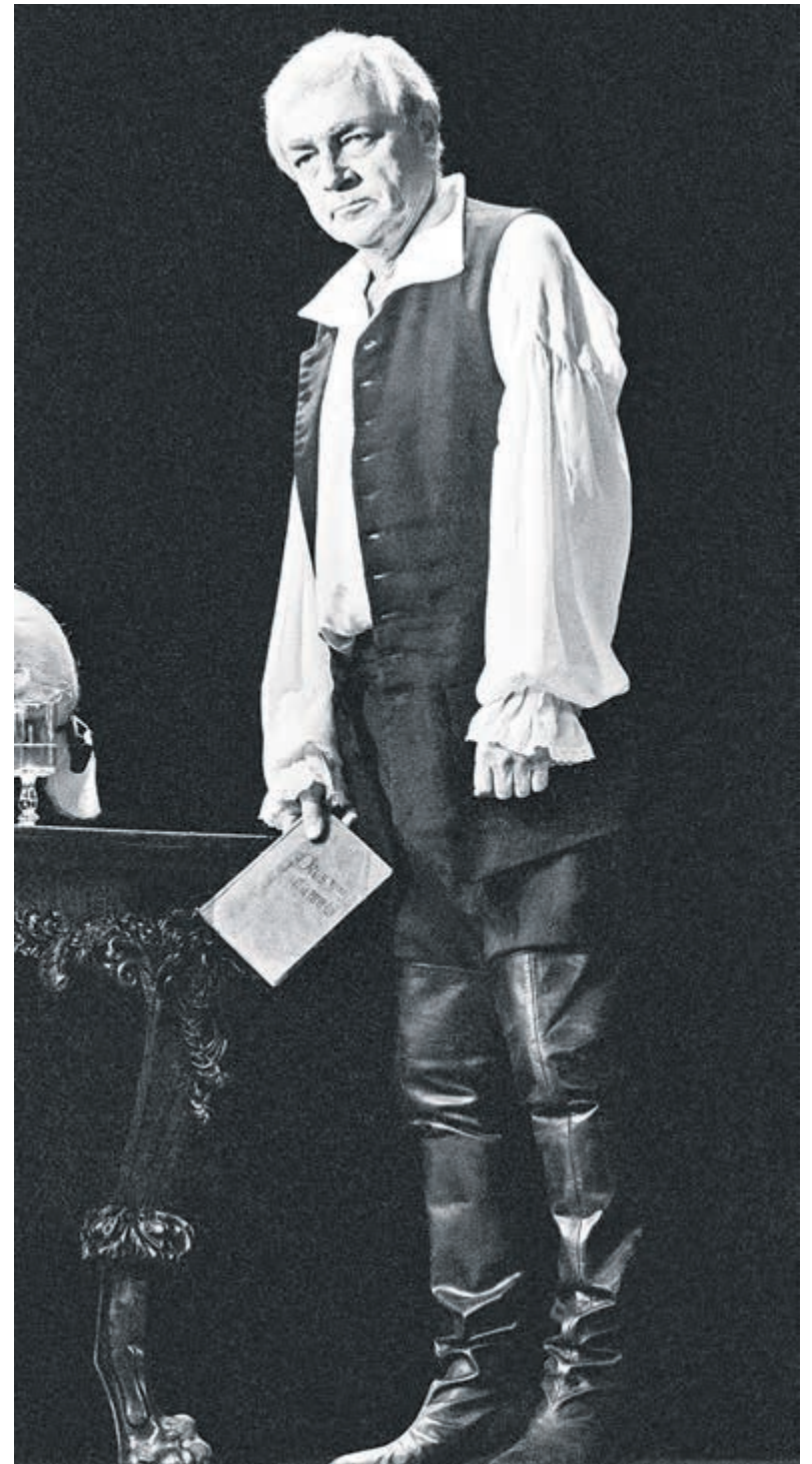
Сцена из спектакля «Коварство и любовь» в постановке Большого драматического театра имени М. Горького (сейчас БДТ им. Г. А. Товстоногова). 1990 год.