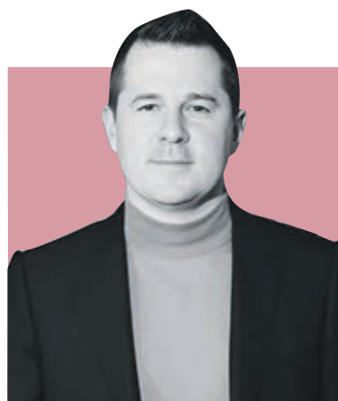
ФЕДОР БОЛТИН, председатель Комитета по культуре Санкт-Петербурга