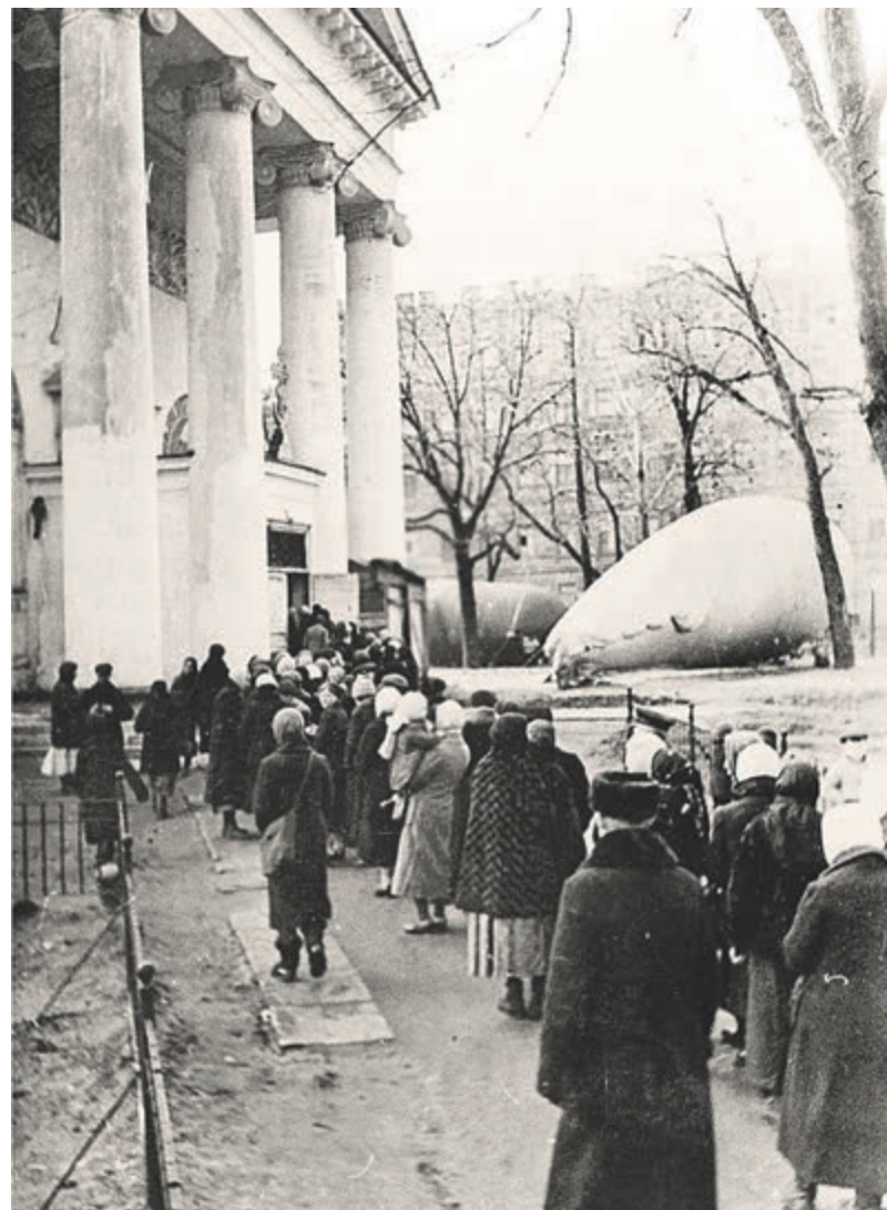
Ленинградцы у Спасо-Преображенского собора на площади Радищева в дни празднования Пасхи. Апрель 1943 года.

Первая военная Пасха 1942 года была очень ранней – 5 апреля. Она совпала с 700-летием Ледового побоища, и многие сочли это добрым знаком.