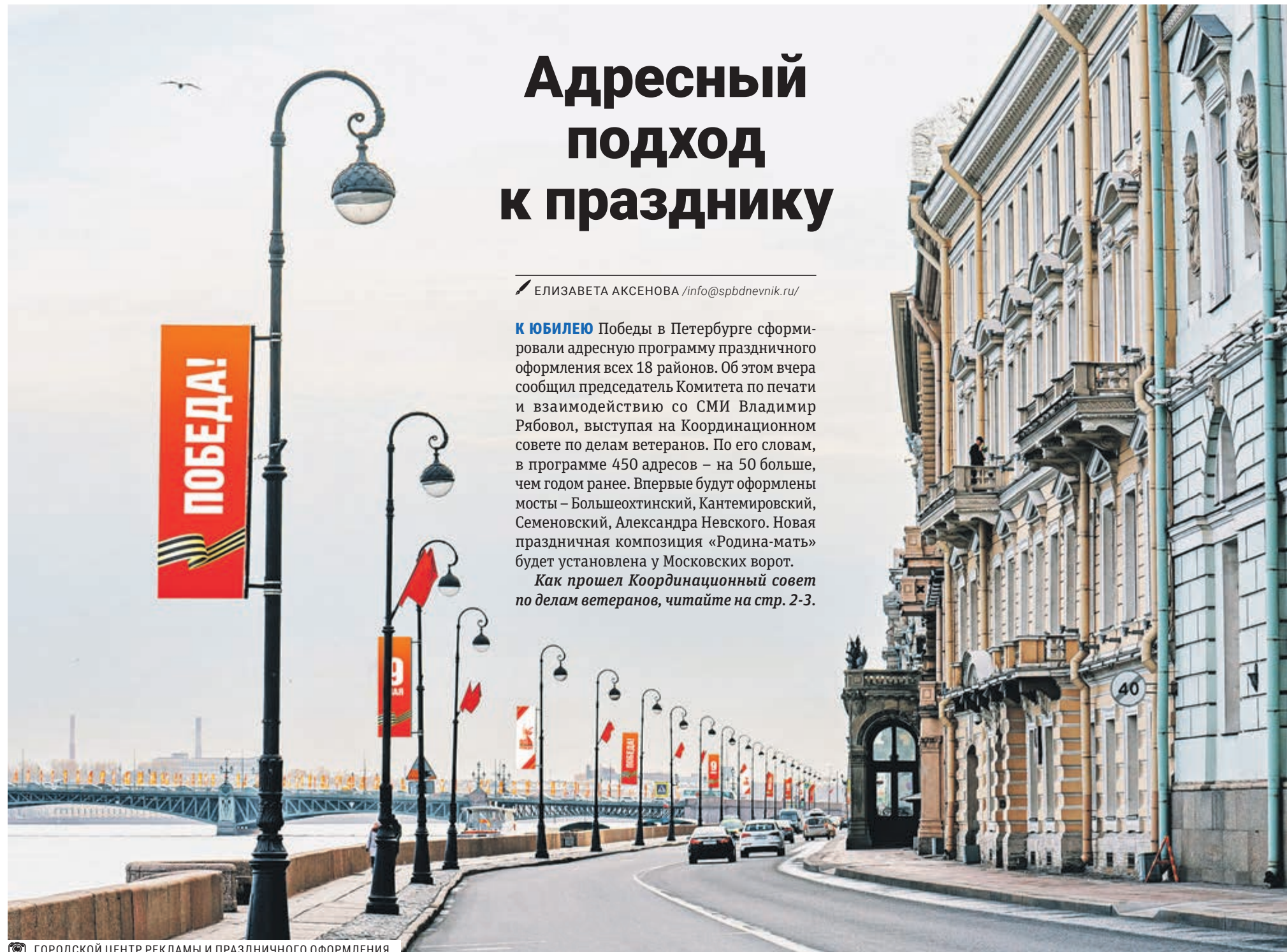
ГОРОДСКОЙ ЦЕНТР РЕКЛАМЫ И ПРАЗДНИЧНОГО ОФОРМЛЕНИЯ

Как прошел Координационный совет по делам ветеранов, читайте на стр. 2-3.