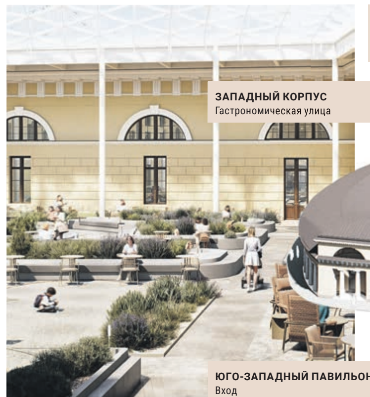
ЗАПАДНЫЙ КОРПУС Гастрономическая улица