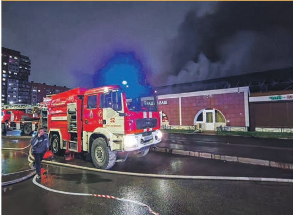
ФОТО ДНЯ / ПОЖАР НА РЫНКЕ ЛОКАЛИЗОВАЛИ