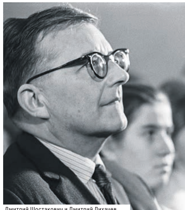
Дмитрий Шостакович и Дмитрий Лихачев

Наступающий год станет особенным для культурной жизни нашего города. В 2026-м исполнится 120 лет со дня рождения Дмитрия Шостаковича и Дмитрия Лихачева.