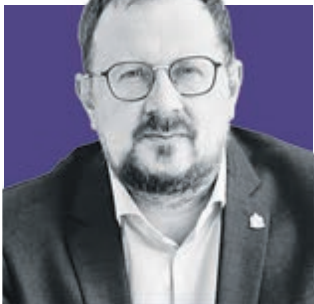
ОЛЕГ ВЕДУТОВ, политолог

длилась прямая линия Владимира Путина в 2024 году. В 2023 году – 4 часа 4 минуты, рекордной стала прямая линия 2008 года – 4 часа 40 минут.