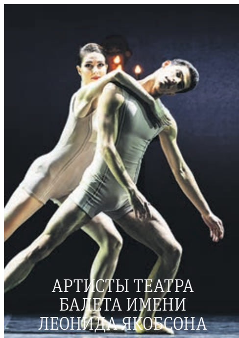
Артисты театра балета имени Леонида Якобсона