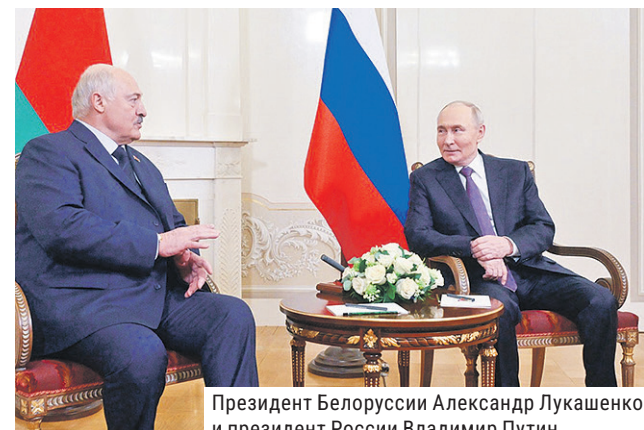
Президент Белоруссии Александр Лукашенко и президент России Владимир Путин