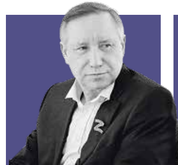
АЛЕКСАНДР БЕГЛОВ, губернатор Санкт-Петербурга

«Какие бы сложные задачи ни ставились руководством государства, конструкторы и специалисты «Рубина» всегда находили оптимальные, основанные на самых передовых достижениях науки и техники решения», – отметил Николай Патрушев.