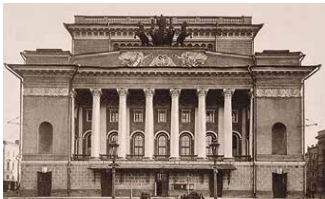
Александринский театр, 1900-е гг.

Карл Росси сумел почувствовать и полюбить красоту нашего северного города, приехав сюда из солнечного Неаполя еще ребенком. 29 декабря исполнится 250 лет со дня рождения зодчего, чьи шедевры стали символами Петербурга.