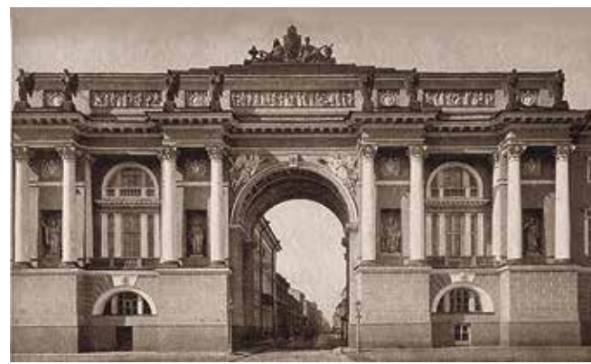
Арка Правительствующего Сената, 1900-е гг.

В честь зодчего в центре Петербурга назвали улицу. Она известна своими идеальными пропорциями: ее длина (220 метров) в десять раз больше ширины улицы и высоты зданий (по 22 метра).