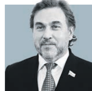
ДМИТРИЙ ПАВЛОВ, депутат Законодательного собрания Санкт-Петербурга

«Это очень правильно – следить за архитектурным обликом Петербурга, анализируя и новинки, и старые здания, нуждающиеся в сохранении. Замечательно и то, что некоторые члены клуба сейчас живут в других странах. Наш город должен быть любим во всем мире!»