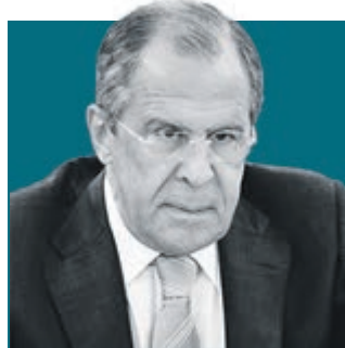
СЕРГЕЙ ЛАВРОВ, министр иностранных дел РФ

Министерство иностранных дел РФ направило приветствие участникам ассамблеи в честь 35-летия Всемирного клуба петербуржцев.