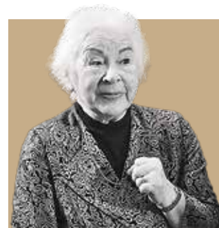
ЕКАТЕРИНА МУРИНА, народная артистка России