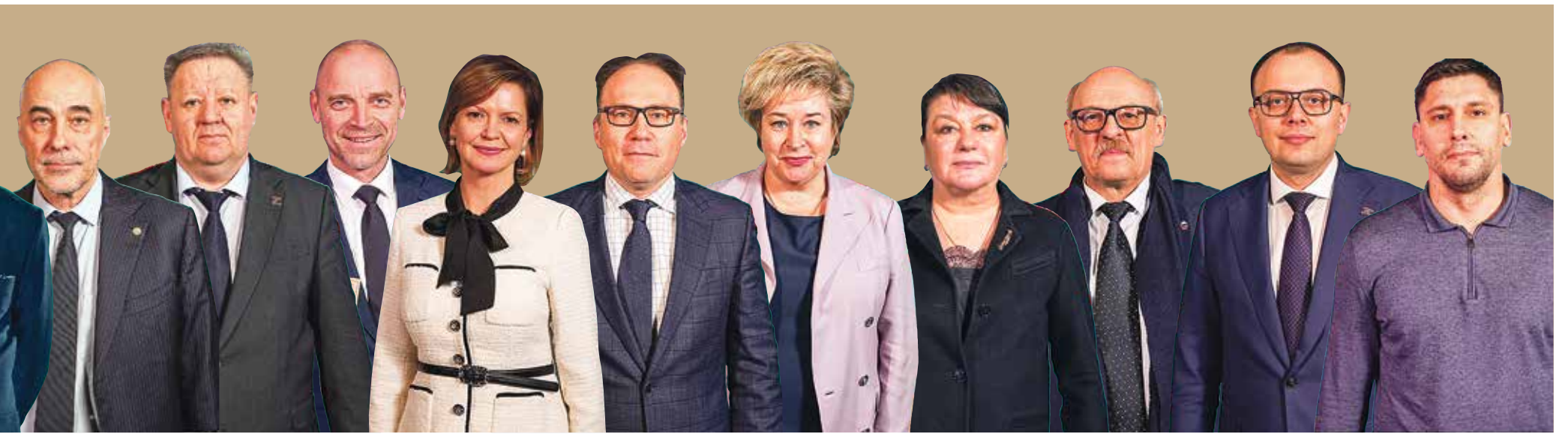
Денис Минкин, председатель Комитета по транспорту, член редакционного совета «Петербургского дневника»