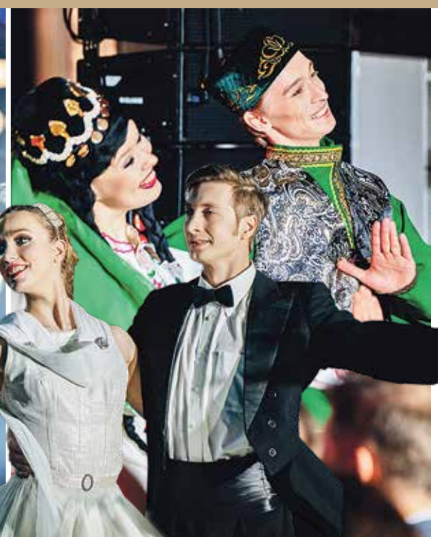
Государственный ансамбль танца «Барыня»